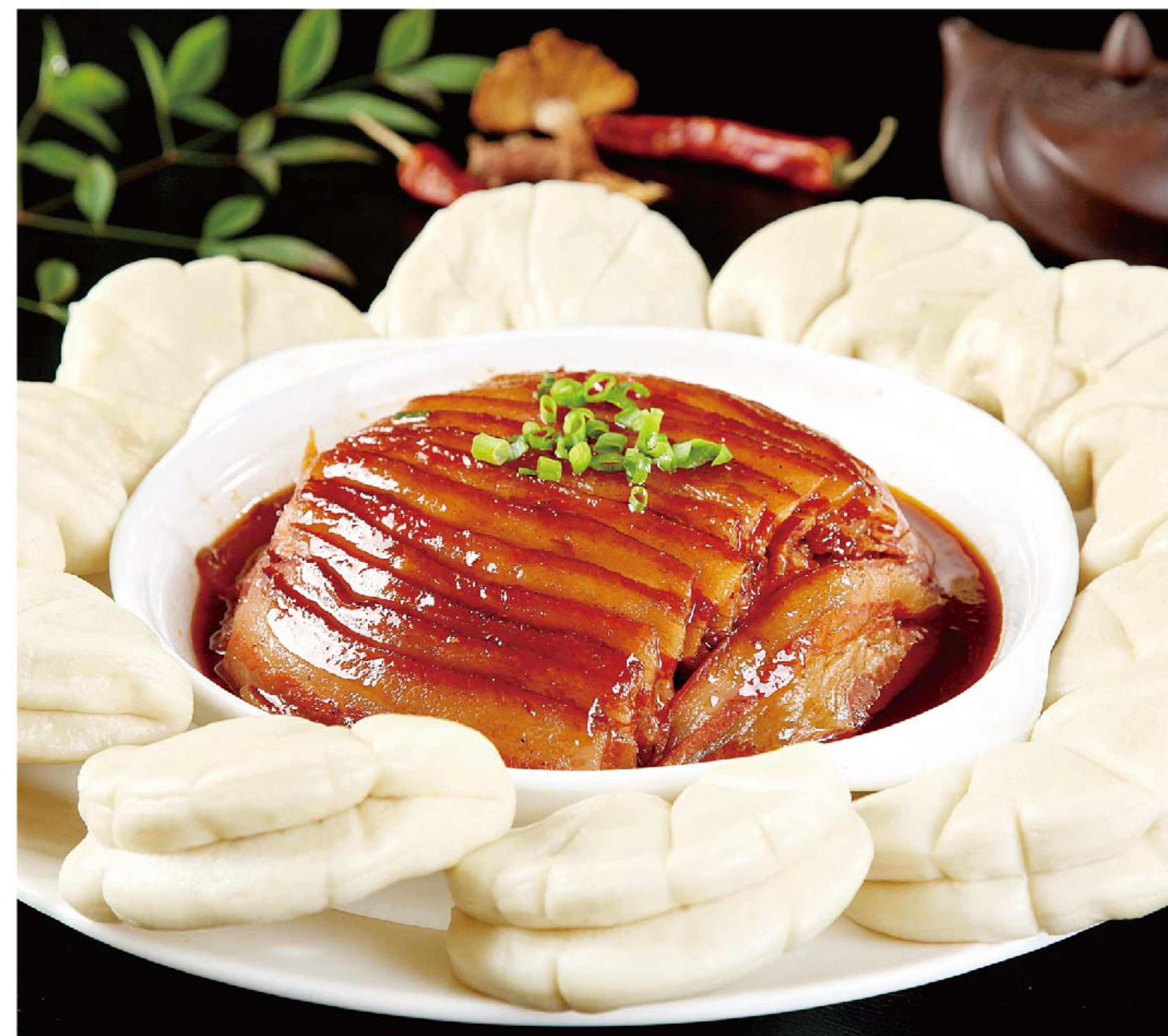
梅菜扣肉 (带饼) MEI CAI KOU ROU RP/258k RP/188k

图片仅供参考·菜品请以实物为准 Harga belum termasuk pajak 10% dan layanan 5%