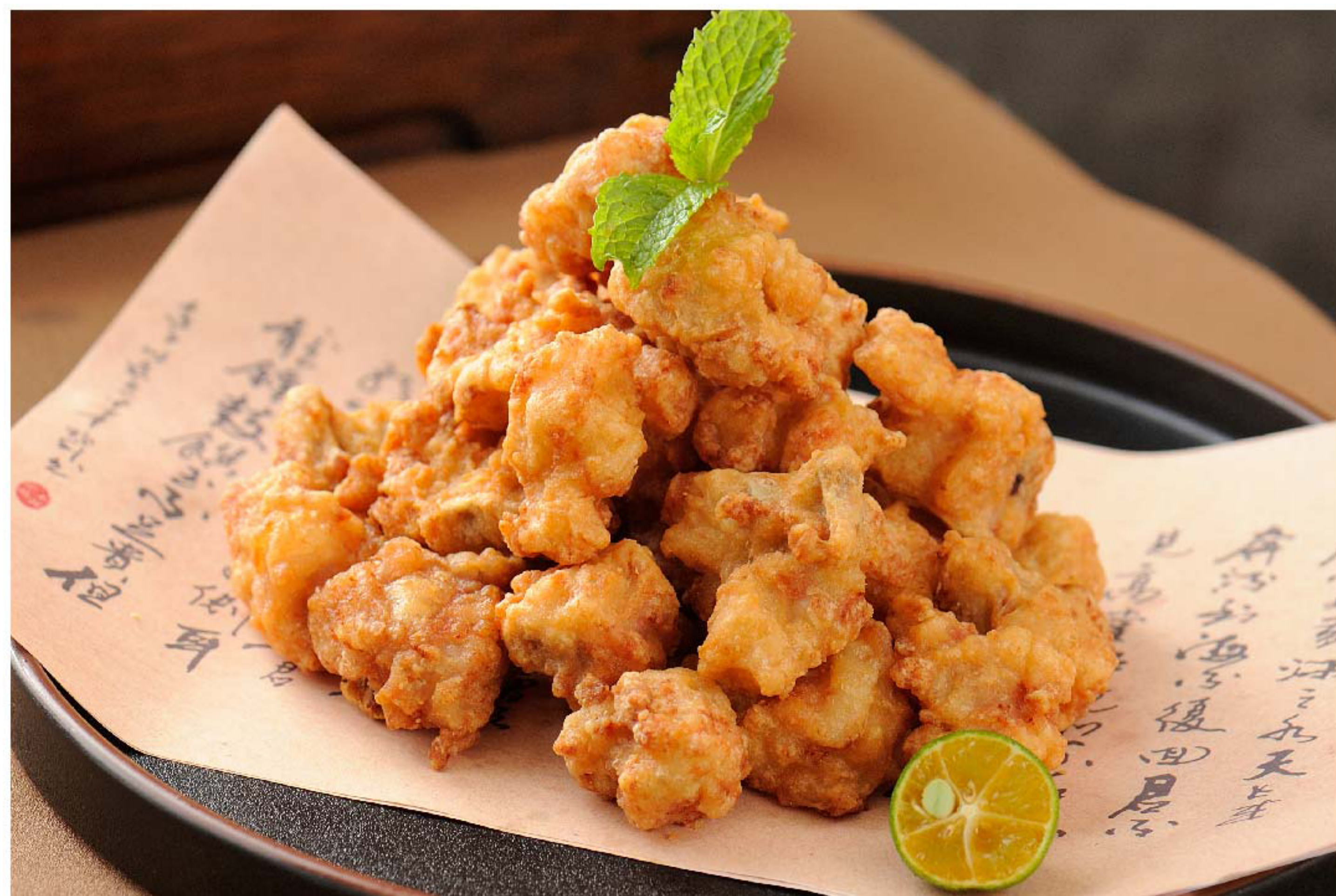
生炸蒜香排骨 IGA BABI GORENG BAWANG RP/ 188k