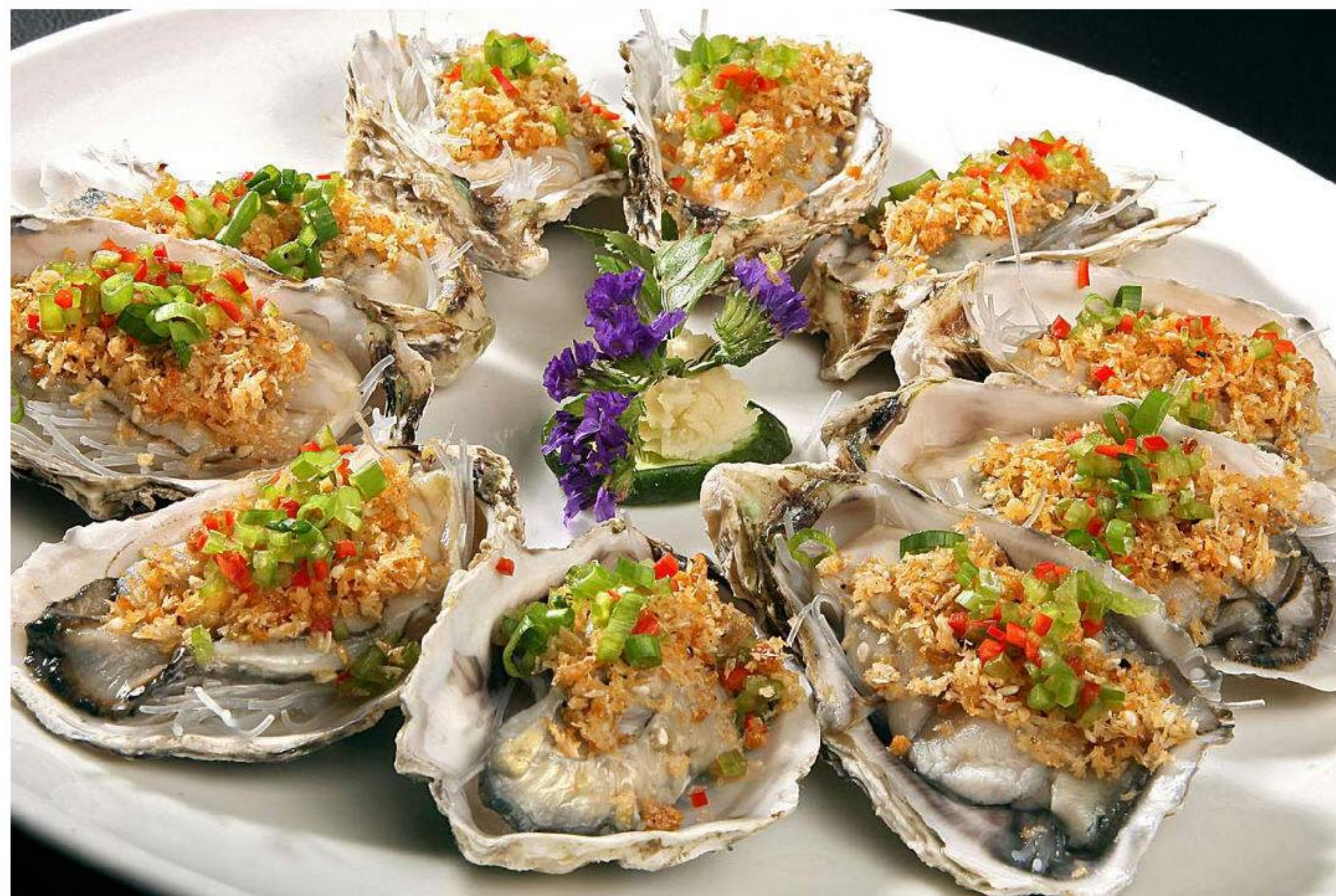
蒜茸粉丝蒸生蚝 OYSTER STEAM BIHUN RP/25k/个