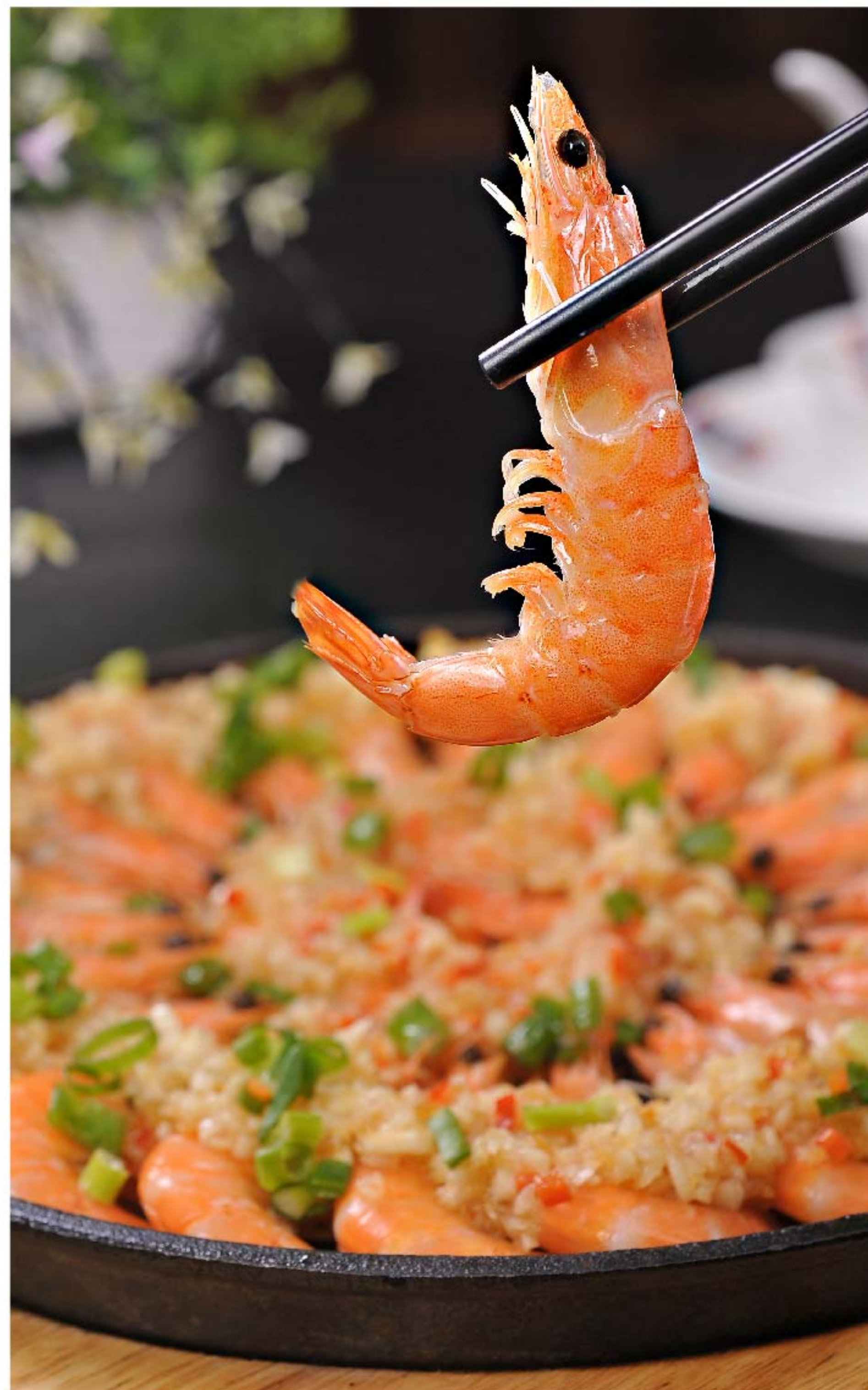
铁板蒜蓉虾 UDANG TEPANYAKI BAWANG PUTIH RP/ 168k