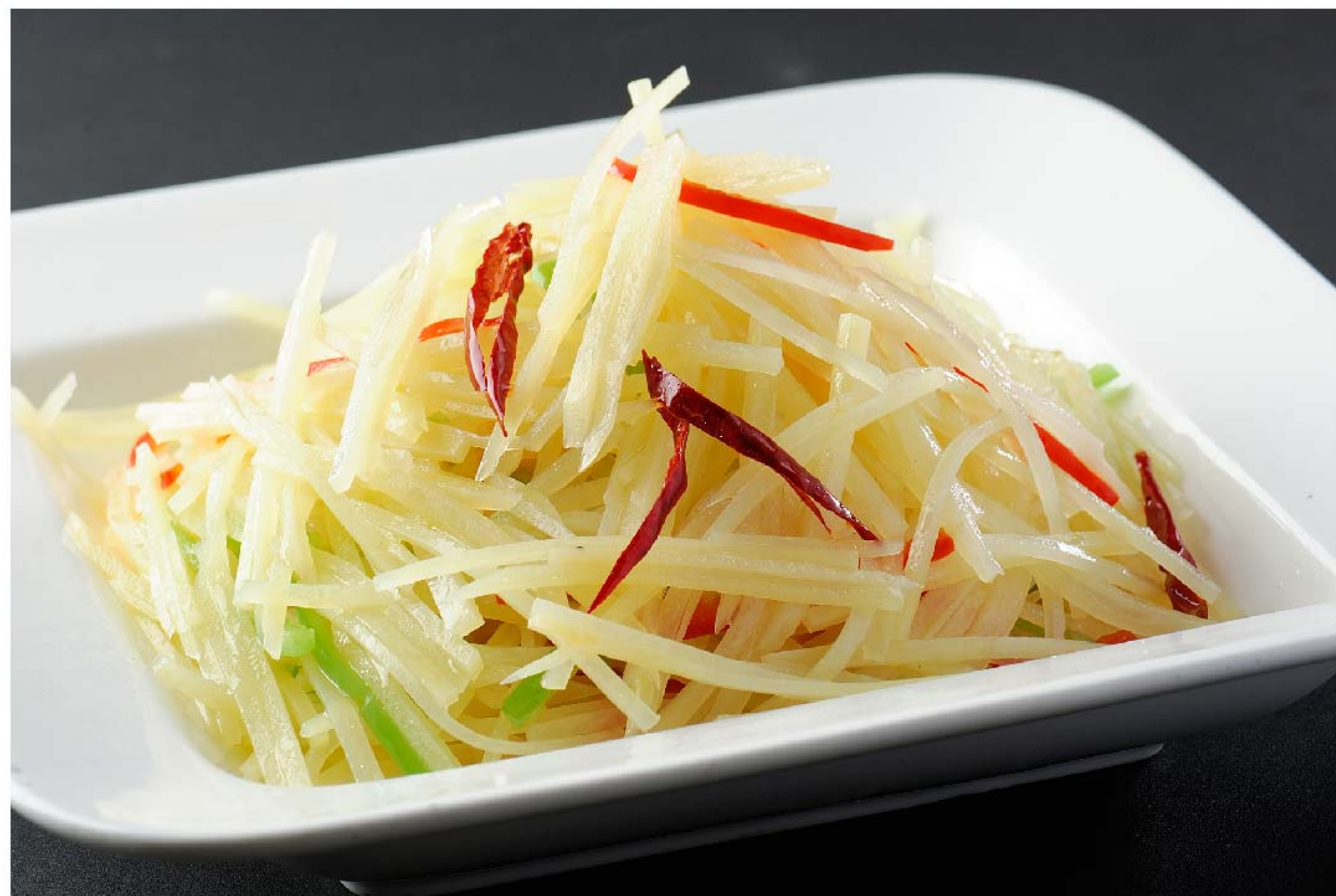
酸辣土豆丝 KENTANG IRIS ASAM PEDAS RP/48k

图片仅供参考·菜品请以实物为准 Harga belum termasuk pajak 10% dan layanan 5%