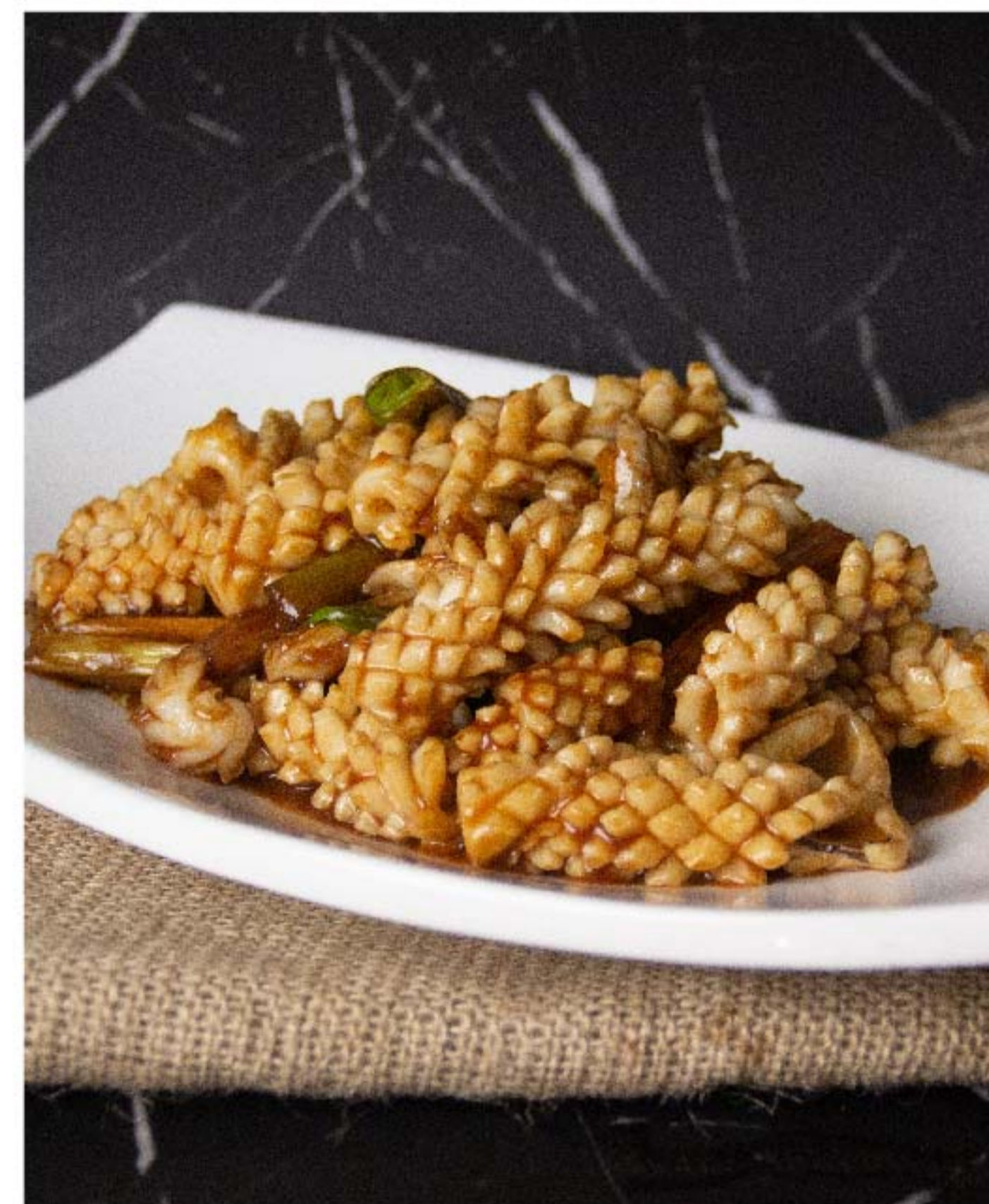
大葱烧墨鱼 CUMI TUMIS DAUN BAWANG RP/ 128k