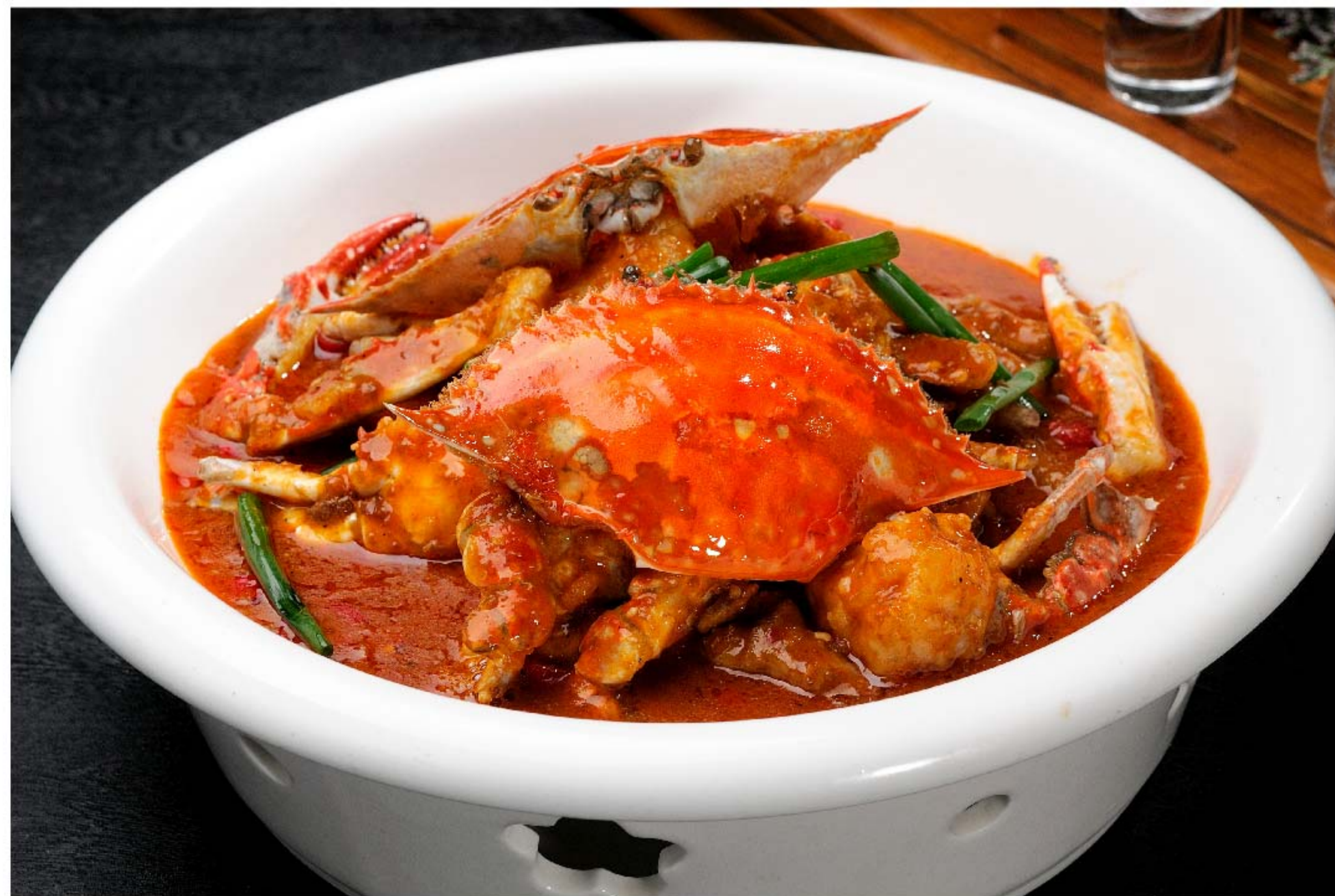
川味香辣蟹 KEPITING TUMIS SECHUAN RP/时价