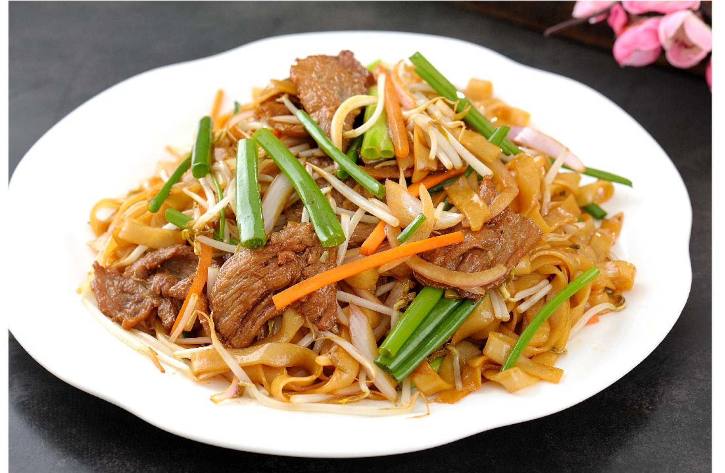
干炒牛河 KWETIAU GORENG SAPI RP/ 58k