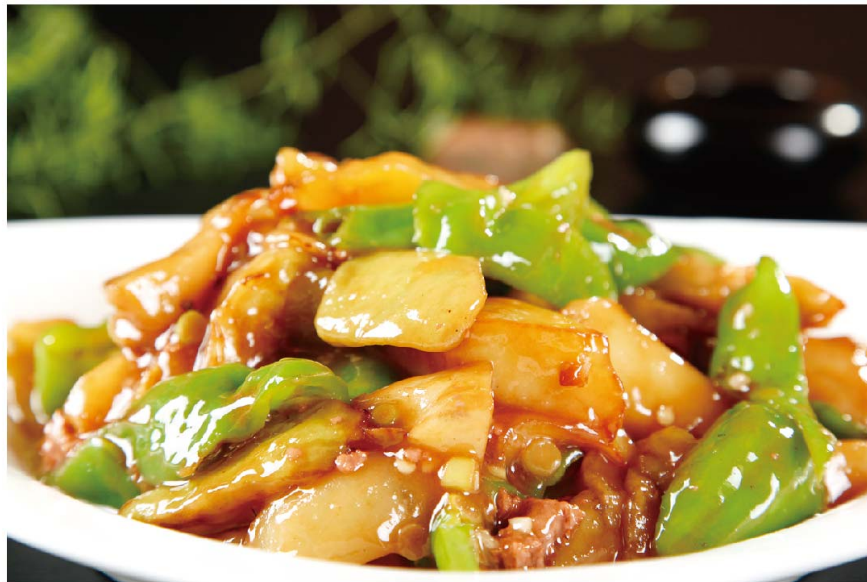
地三鲜 TIGA SAYUR ANGSIO RP/56k