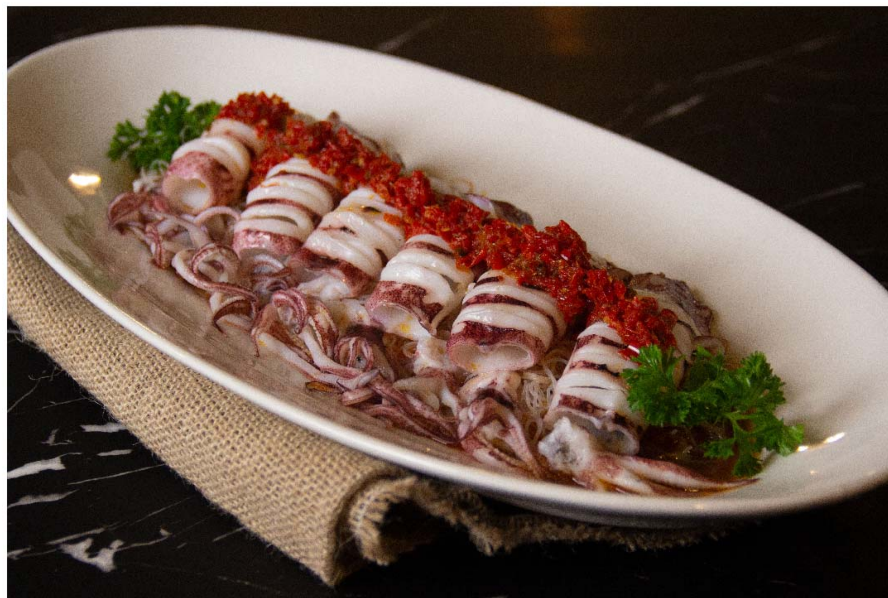
粉丝蒸鲜鱿鱼 (蒜茸味、剁椒蒸) CUMI STEAM BIHUN RP/ 158k

图片仅供参考·菜品请以实物为准 Harga belum termasuk pajak 10% dan layanan 5%