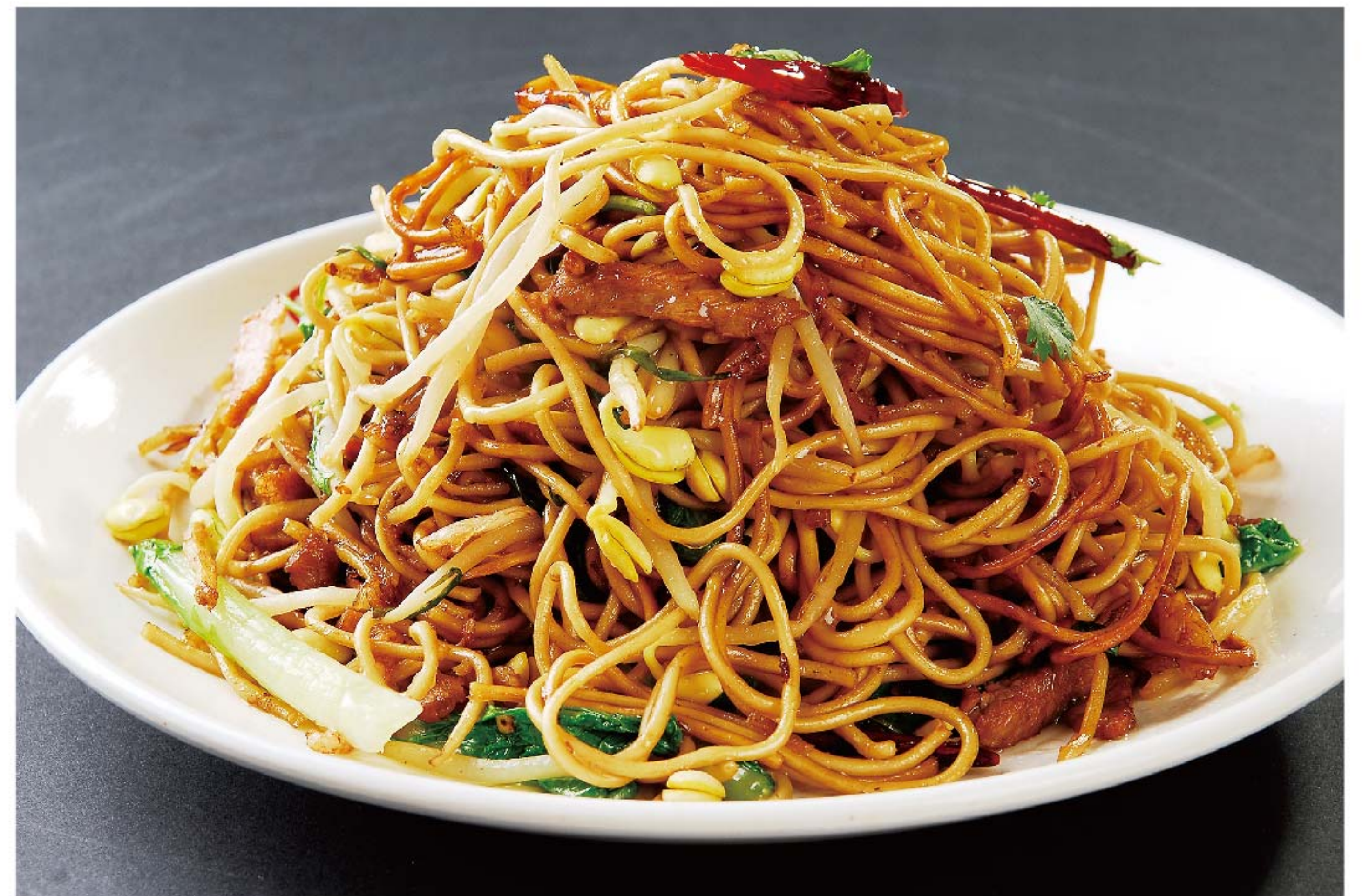
海鲜炒面 MIE GORENG SEAFOOD RP/ 58k

图片仅供参考·菜品请以实物为准 Harga belum termasuk pajak 10% dan layanan 5%