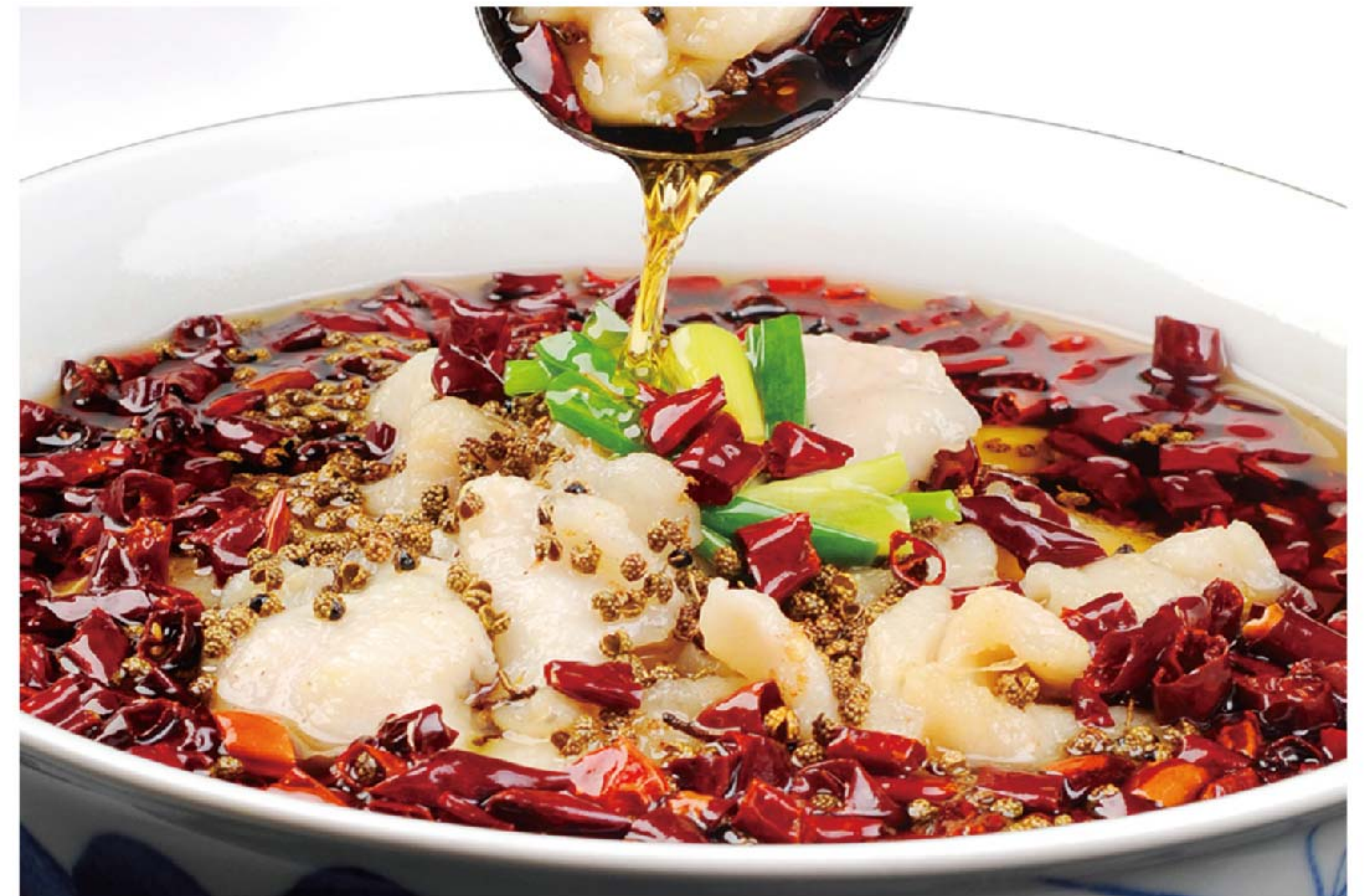
川香麻辣鱼 IKAN KUAH MALA RP/228k

图片仅供参考·菜品请以实物为准 Harga belum termasuk pajak 10% dan layanan 5%