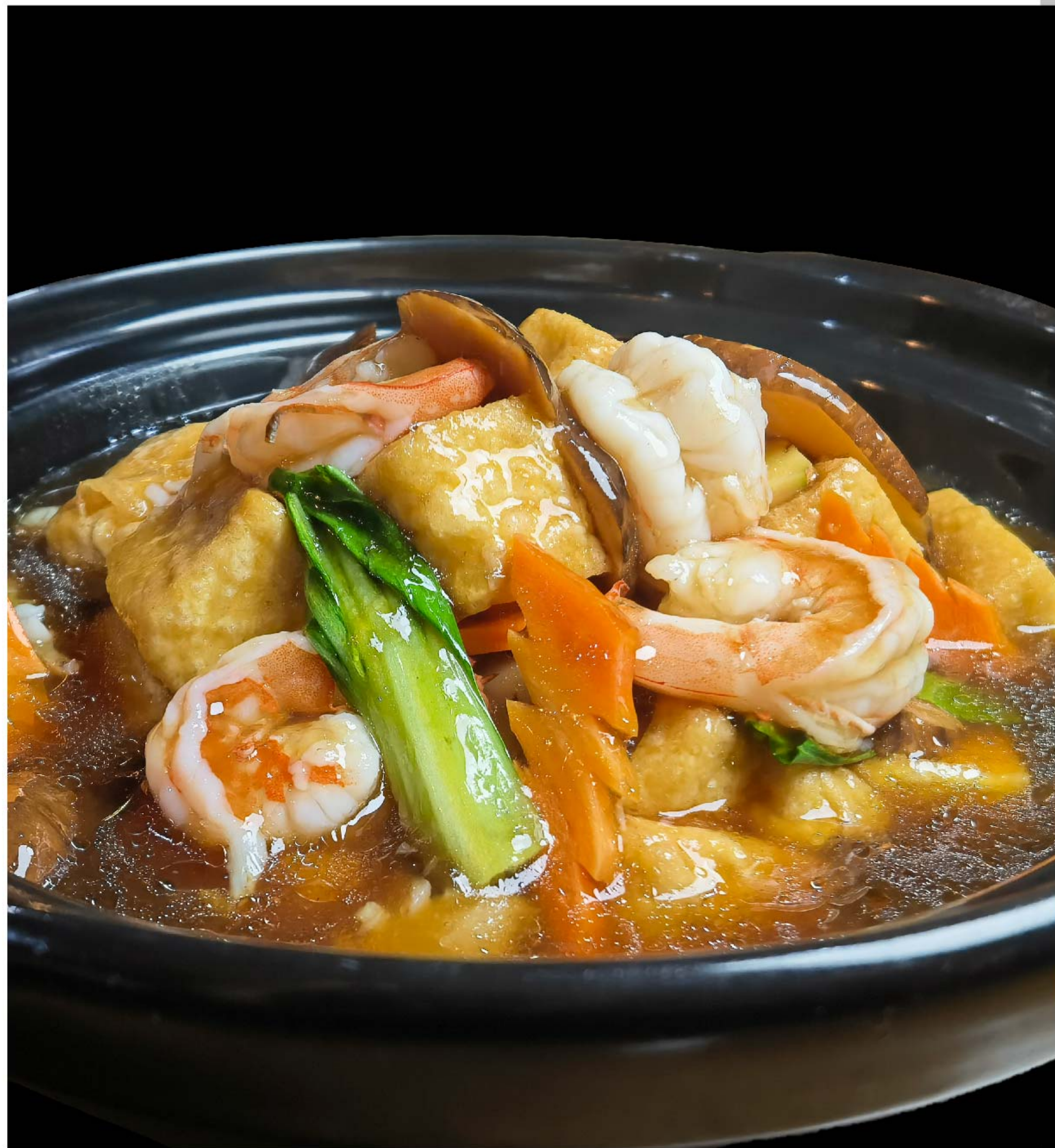
海鲜豆腐煲 SAPO TAHU SEAFOOD RP/79k