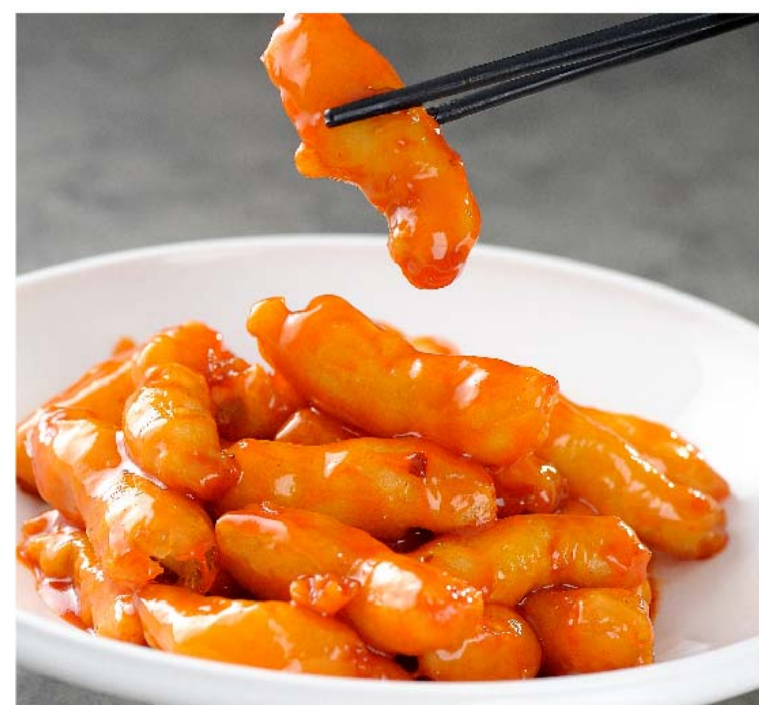
糖醋鸡柳 AYAM ASAM MANIS RP/88k

图片仅供参考·菜品请以实物为准 Harga belum termasuk pajak 10% dan layanan 5%