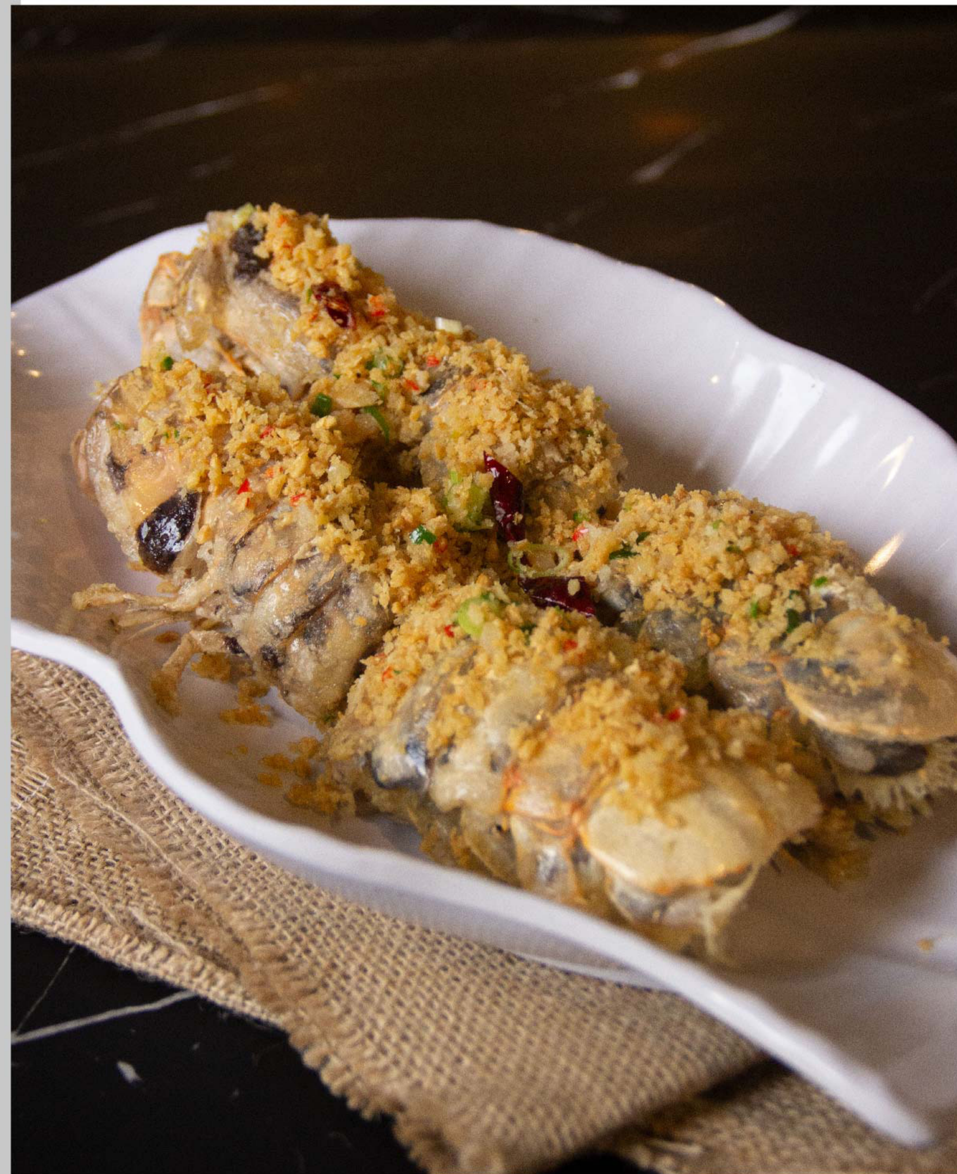
椒盐皮皮虾 RONGGENG CABE GARAM RP/时价