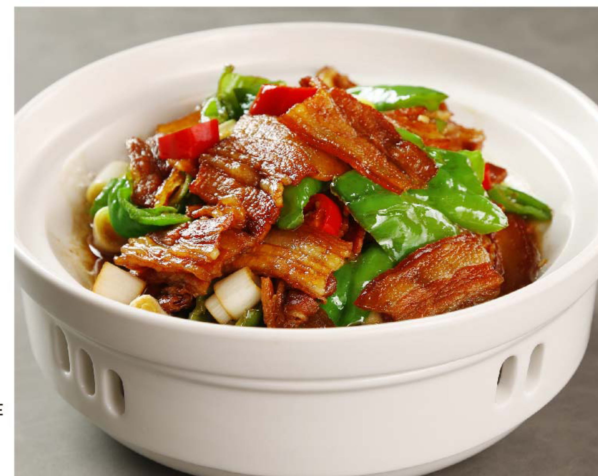
辣椒炒肉 BABI SAMCAN TUMIS CABE RP/ 156k

图片仅供参考·菜品请以实物为准 Harga belum termasuk pajak 10% dan layanan 5%