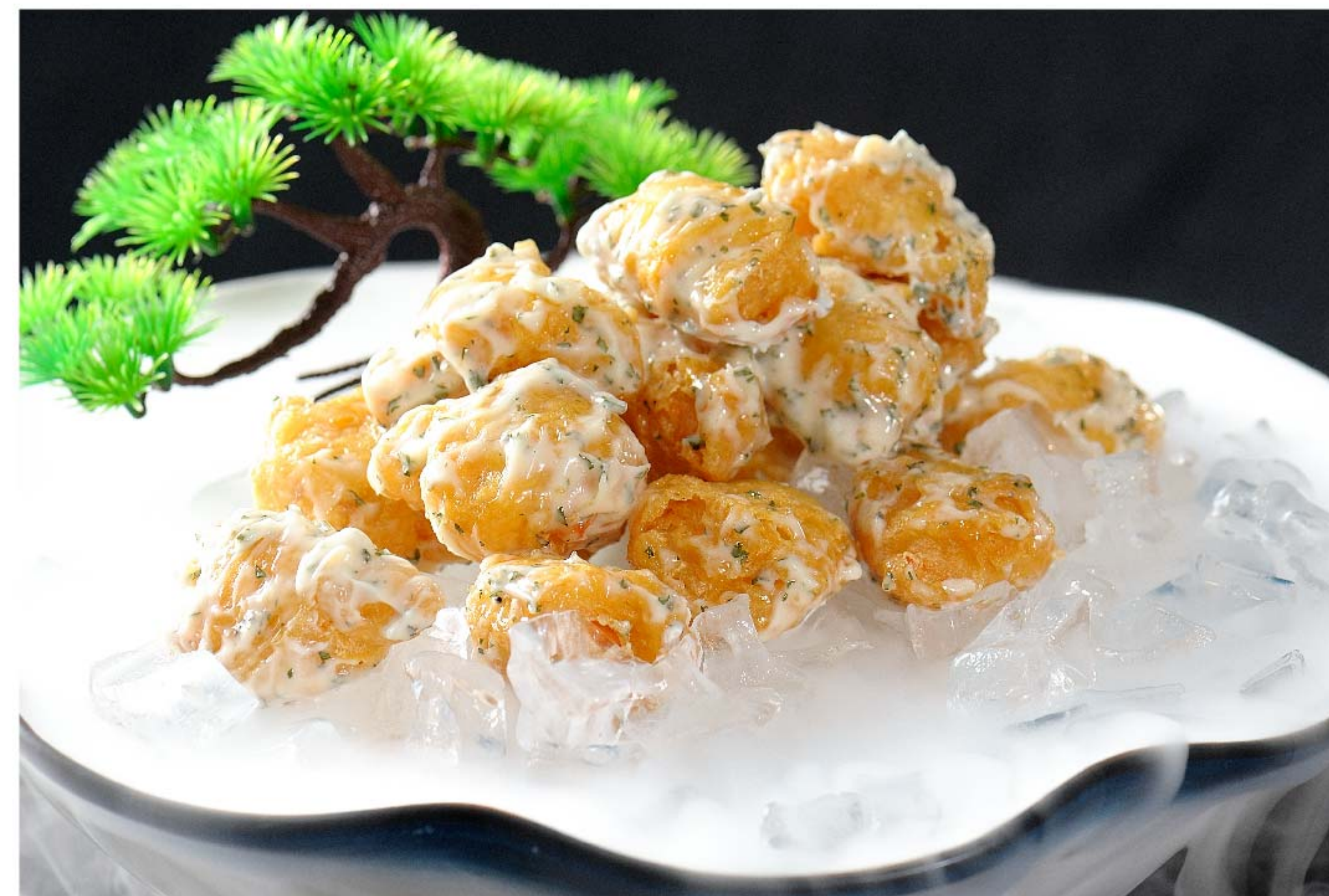
沙律虾球 UDANG GORENG MAYONAISE RP/ 168k

图片仅供参考·菜品请以实物为准 Harga belum termasuk pajak 10% dan layanan 5%