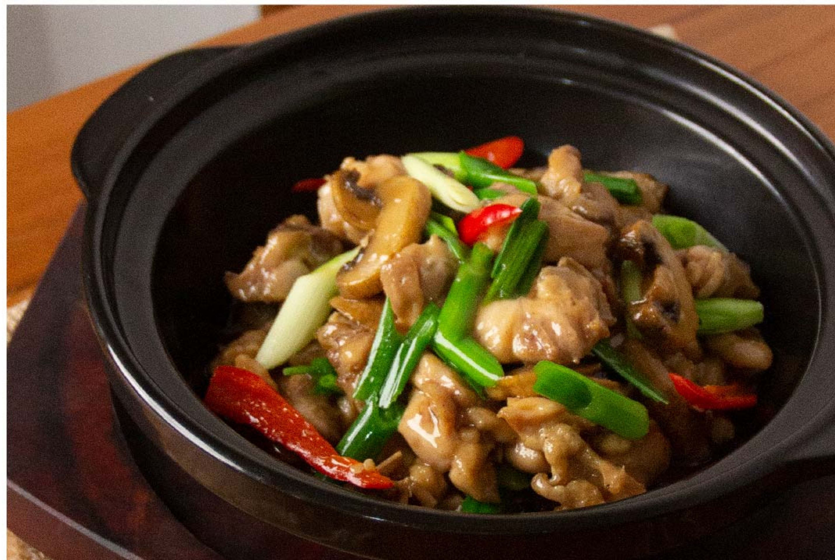
口蘑炒滑鸡 AYAM TUMIS JAMUR RP/ 128k