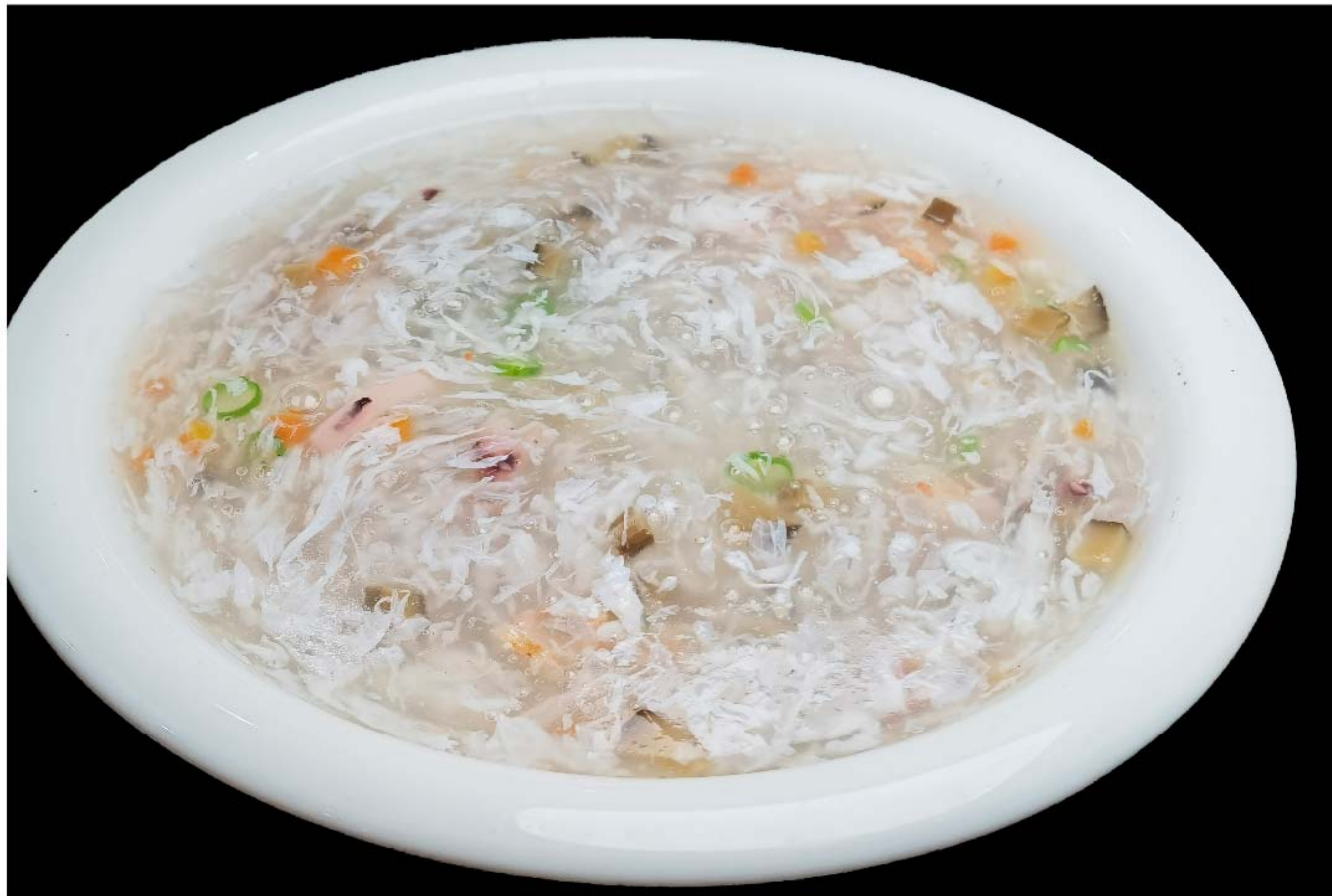
海鲜羹 SUP SEAFOOD RP/68k

图片仅供参考·菜品请以实物为准 Harga belum termasuk pajak 10% dan layanan 5%