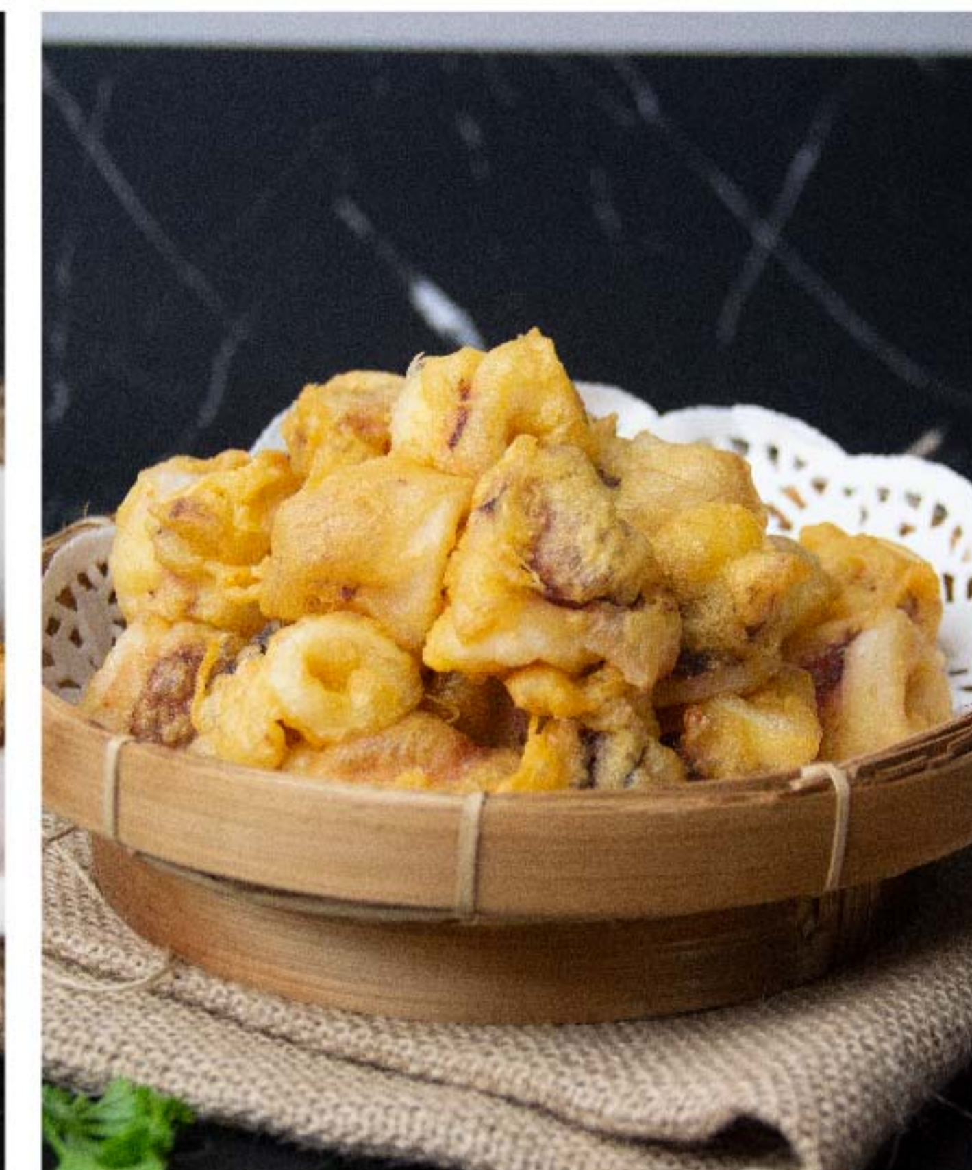
炸鱿鱼 CUMI GORENG RP/ 128k 咸蛋炒鱿鱼 CUMI TELUR ASIN RP/ 128k