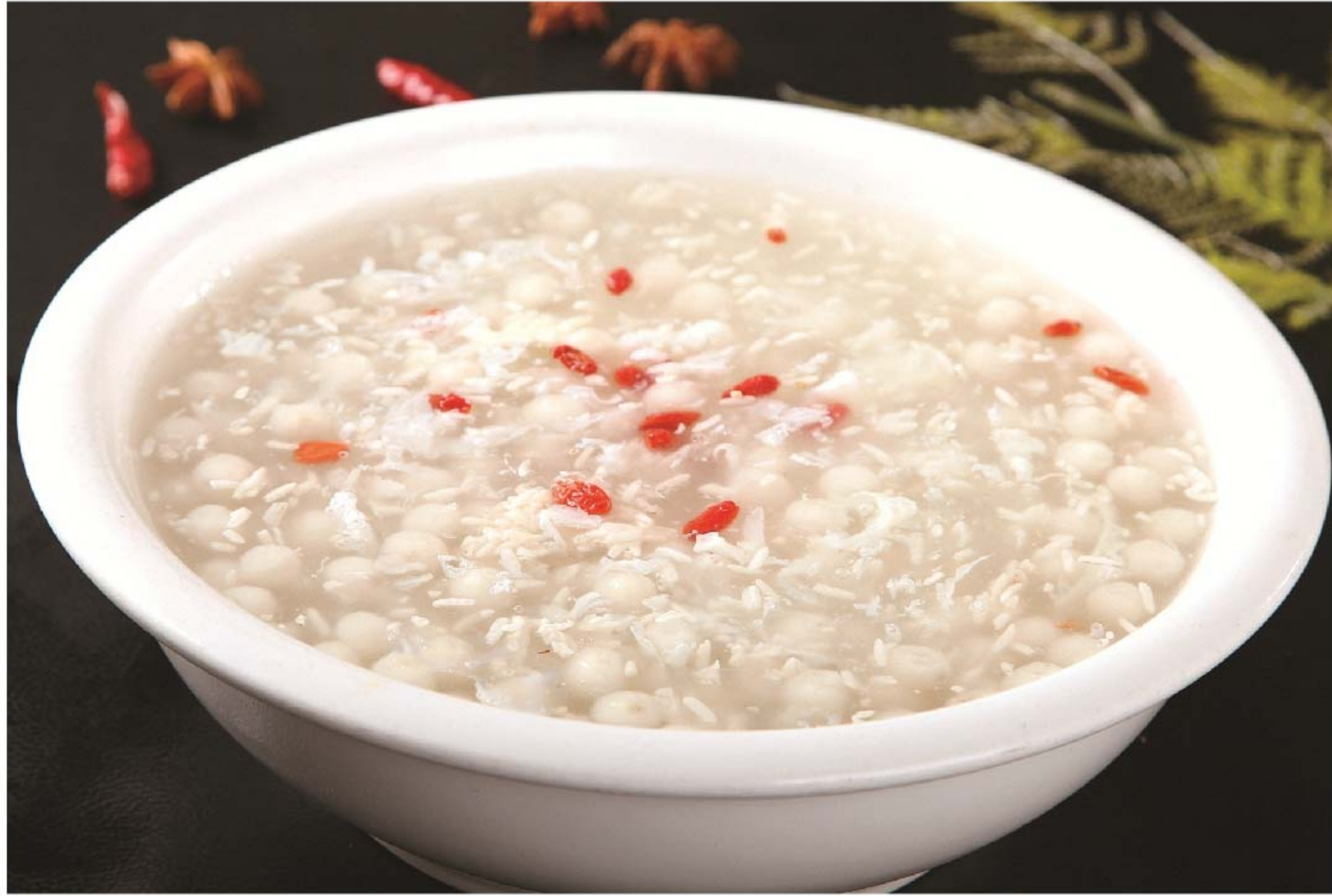
米酒汤圆 TANGYUAN MIU RP/58k