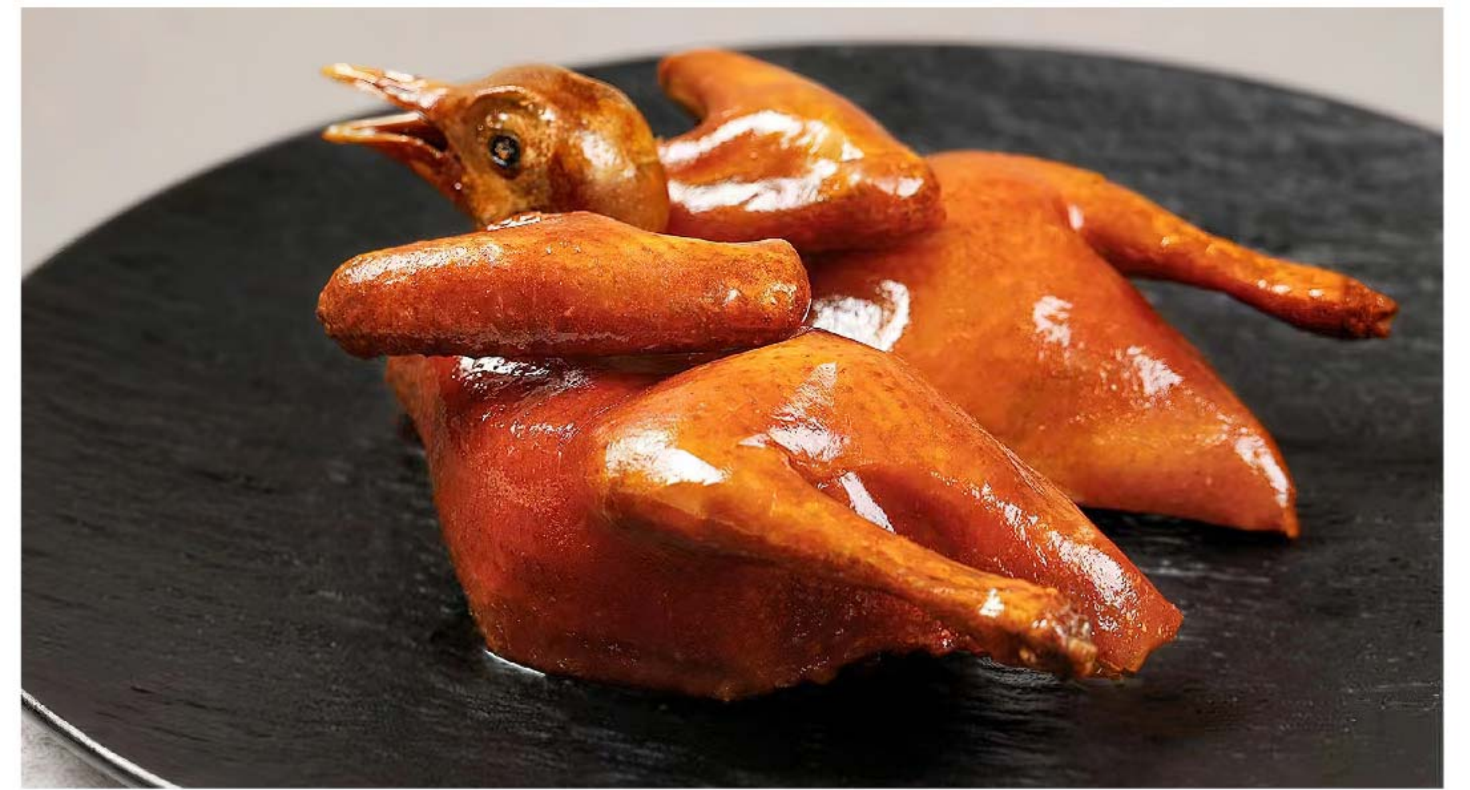
脆皮乳鸽 BURUNG DARA KRISPY RP/88k