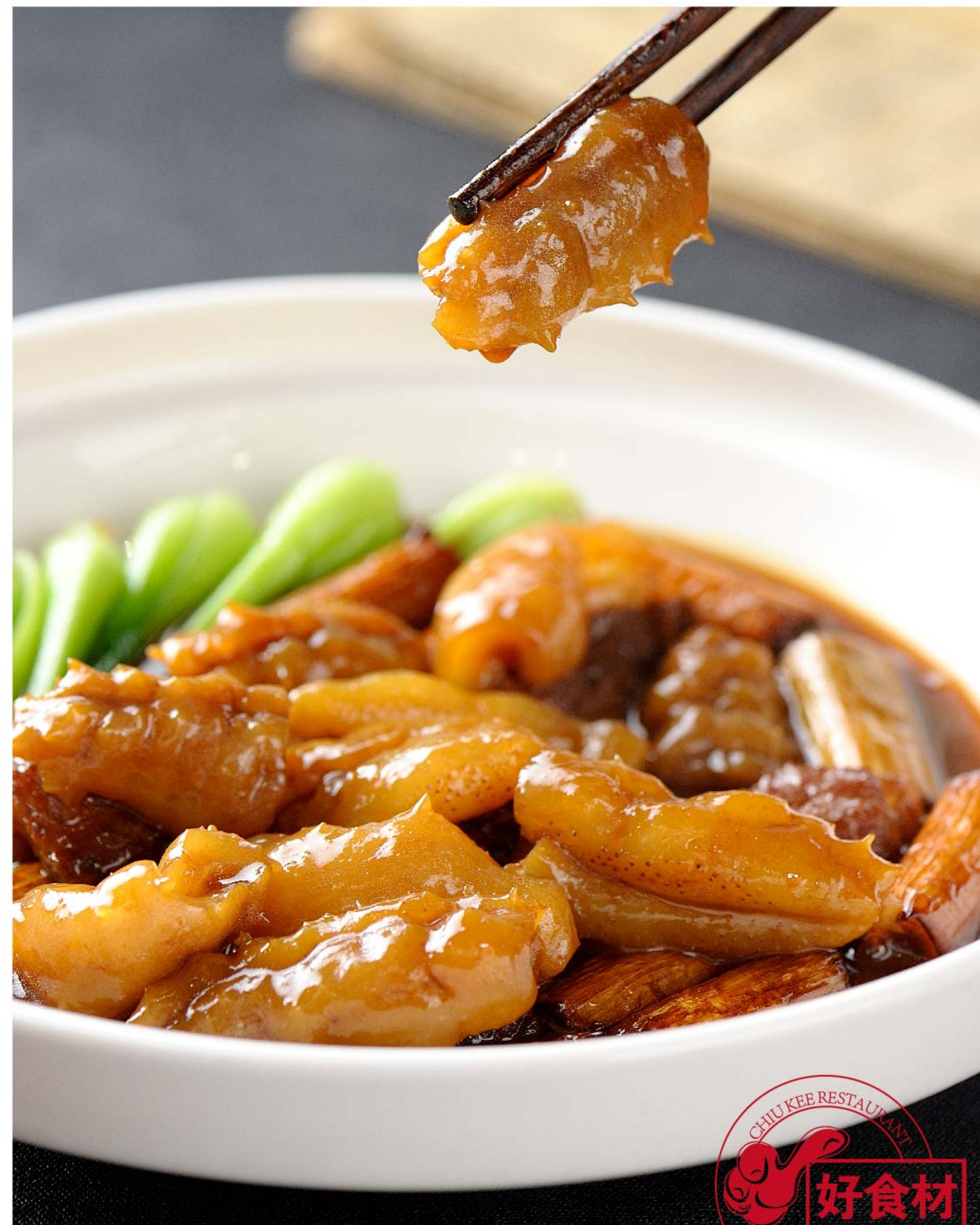
大葱烧印尼野生白海参 TERIPANG ANGSIO DAUN BAWANG RP/398k