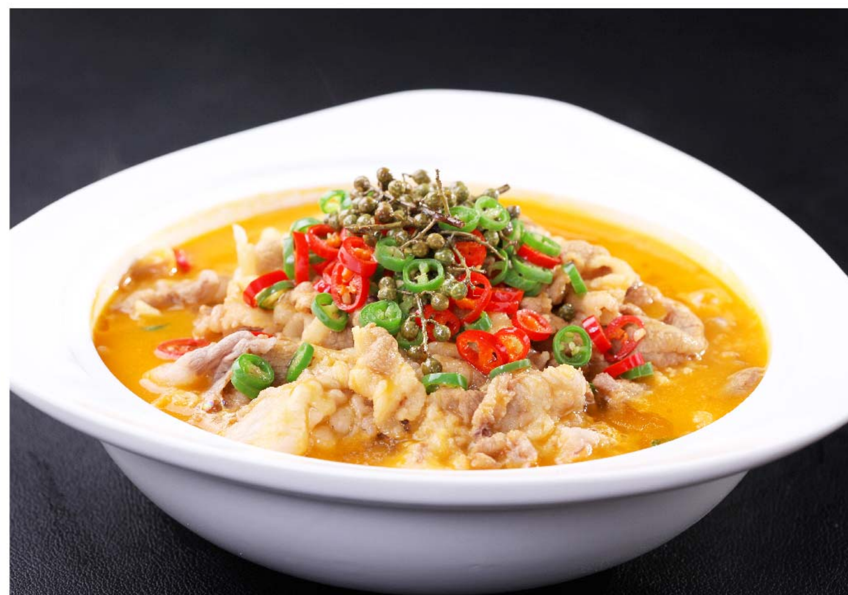
酸汤肥牛 SAPI SIRLOIN KUAH ASAM RP/ 188k

图片仅供参考·菜品请以实物为准 Harga belum termasuk pajak 10% dan layanan 5%