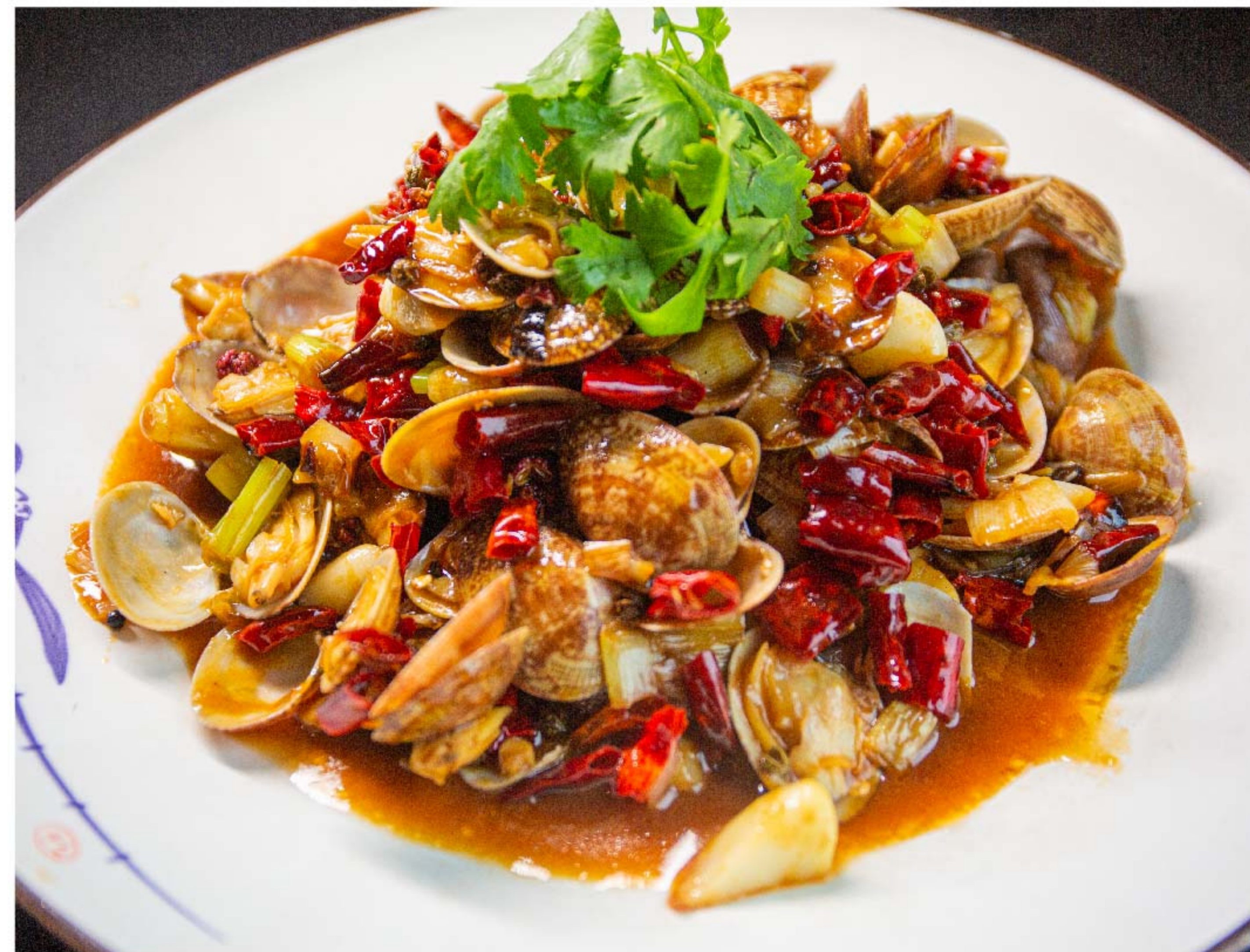
辣炒花甲 KERANG TUMIS PEDAS RP/ 68k