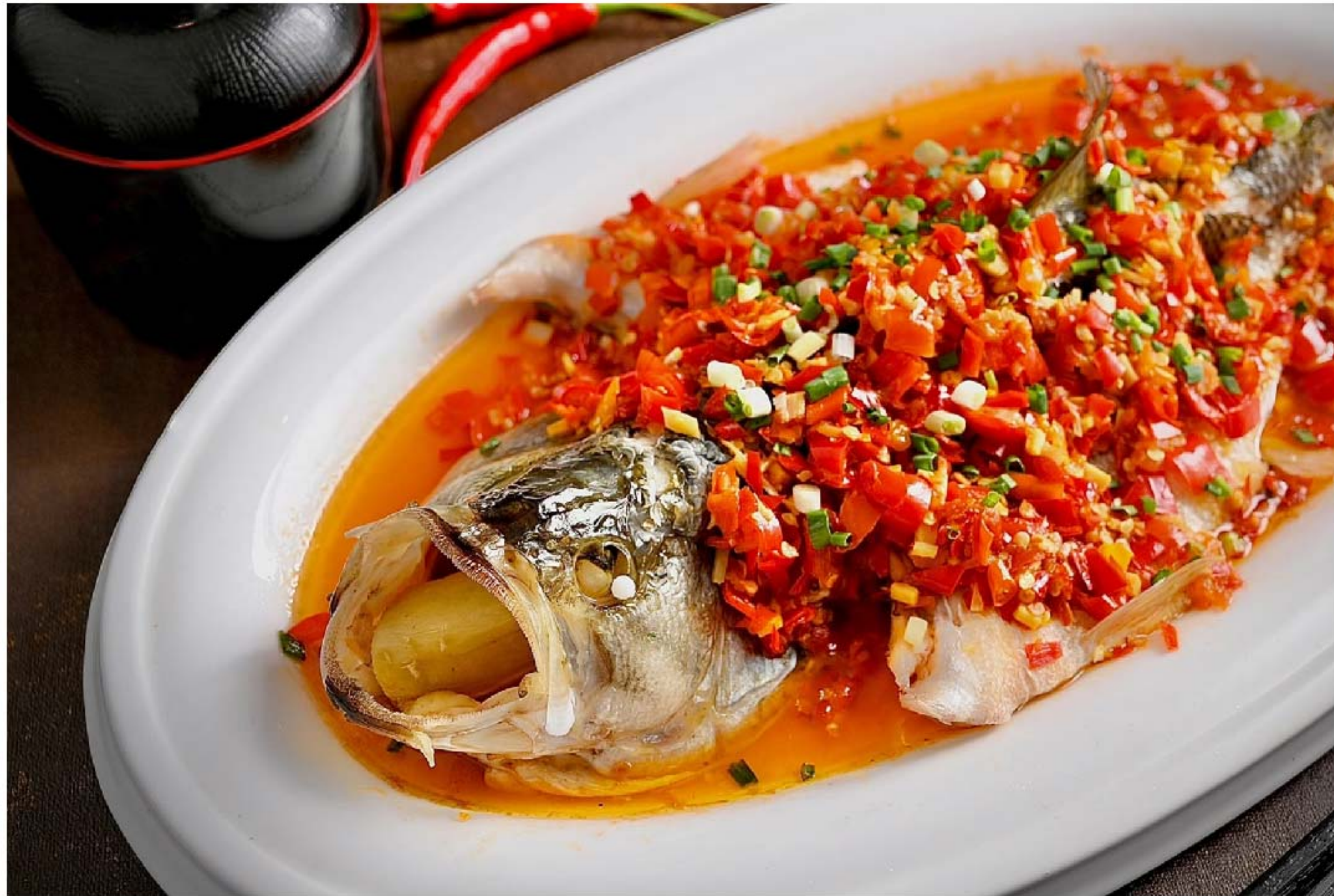
剁椒蒸石斑鱼 IKAN STEAM CABE MERAH RP/时价