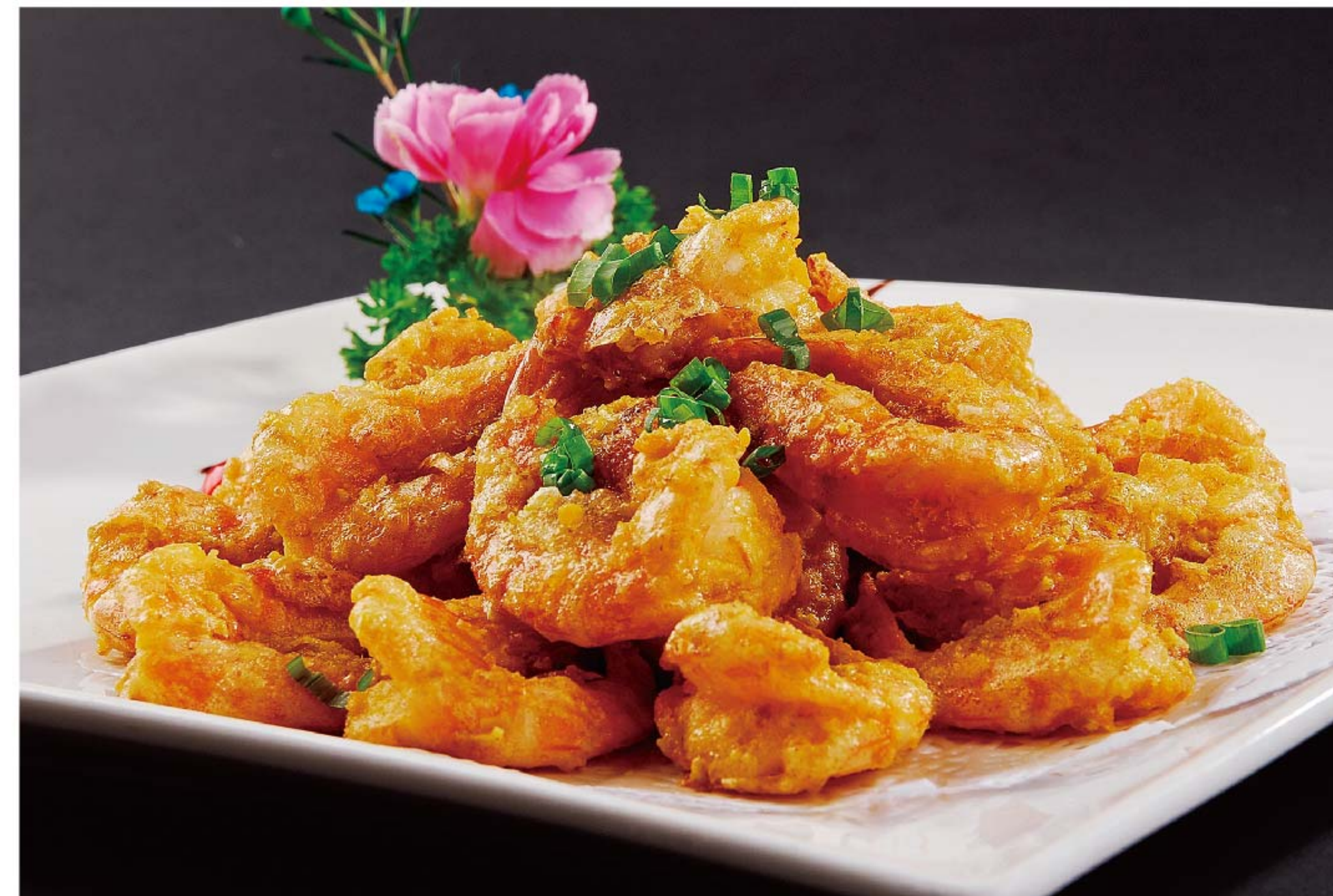
咸蛋黄炒大虾 UDANG TELUR ASIN RP/ 148k