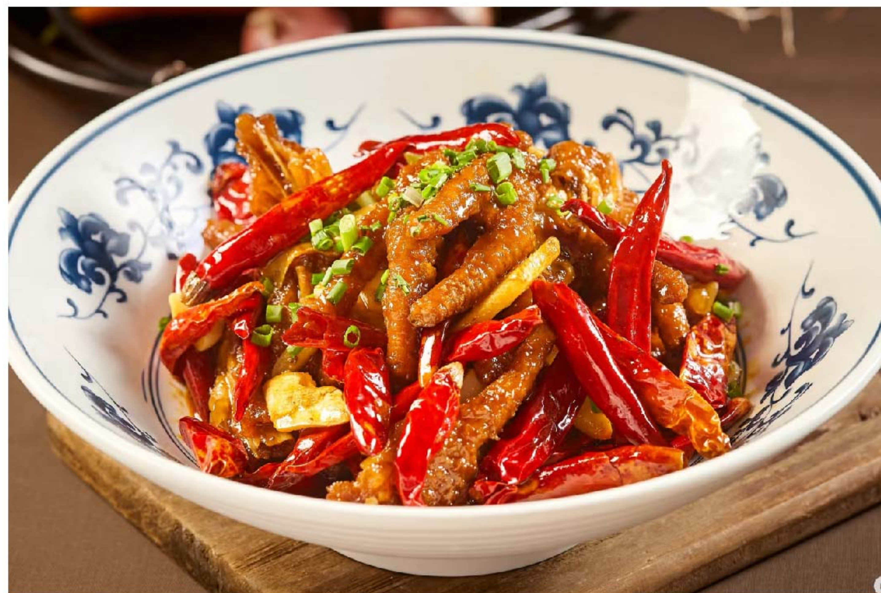
辣炒凤爪 KAKI AYAM.TUMIS PEDAS RP/98k

图片仅供参考·菜品请以实物为准 Harga belum termasuk pajak 10% dan layanan 5%