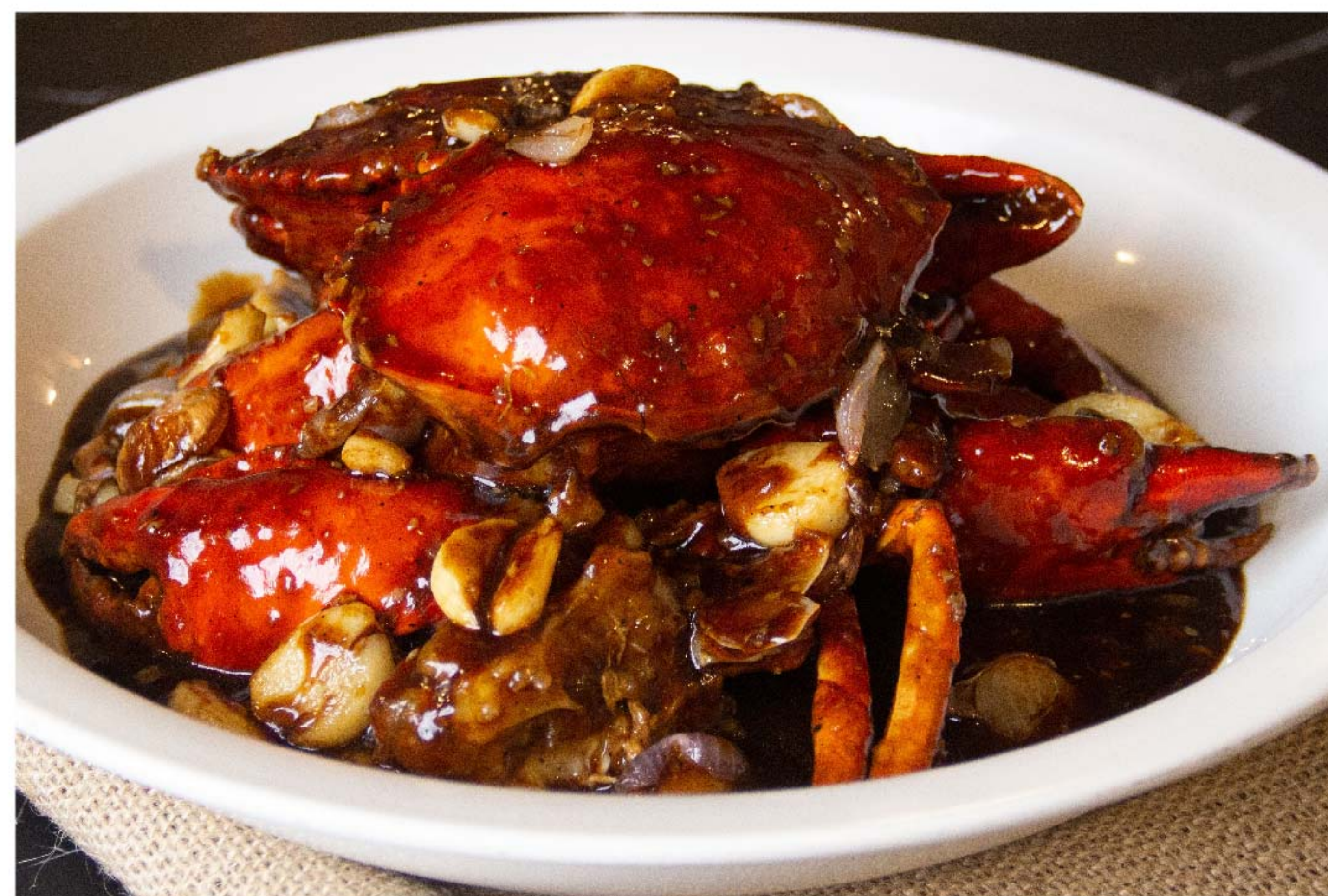
红葱头黑胡椒炒蟹 KEPITING LADA HITAM RP/时价

图片仅供参考·菜品请以实物为准 Harga belum termasuk pajak 10% dan layanan 5%