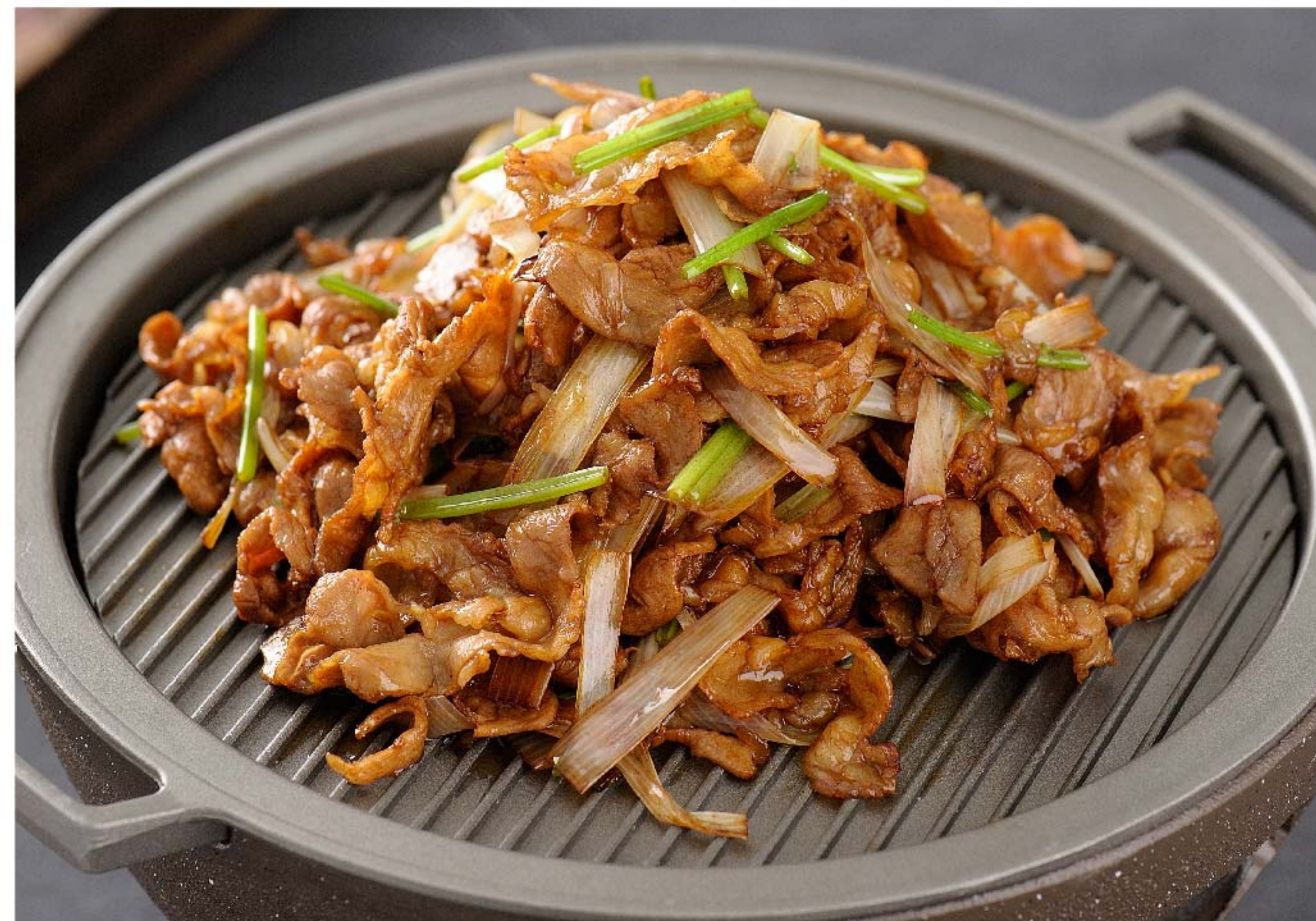
葱爆牛肉 SAPI DAUN BAWANG RP/ 158k