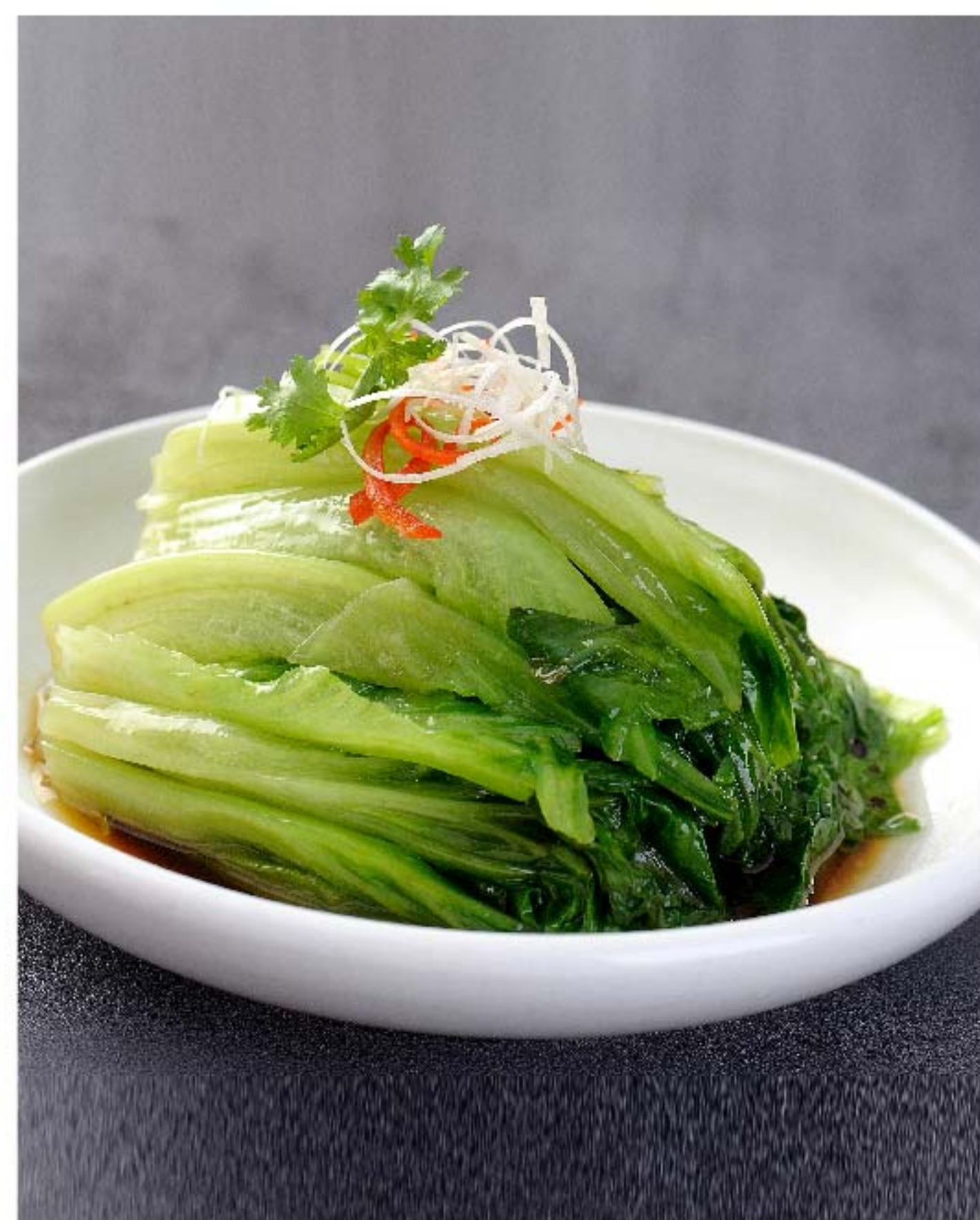
白灼罗马生菜 SELADA ROMAINE SAOS HK RP/58k

图片仅供参考·菜品请以实物为准 Harga belum termasuk pajak 10% dan layanan 5%