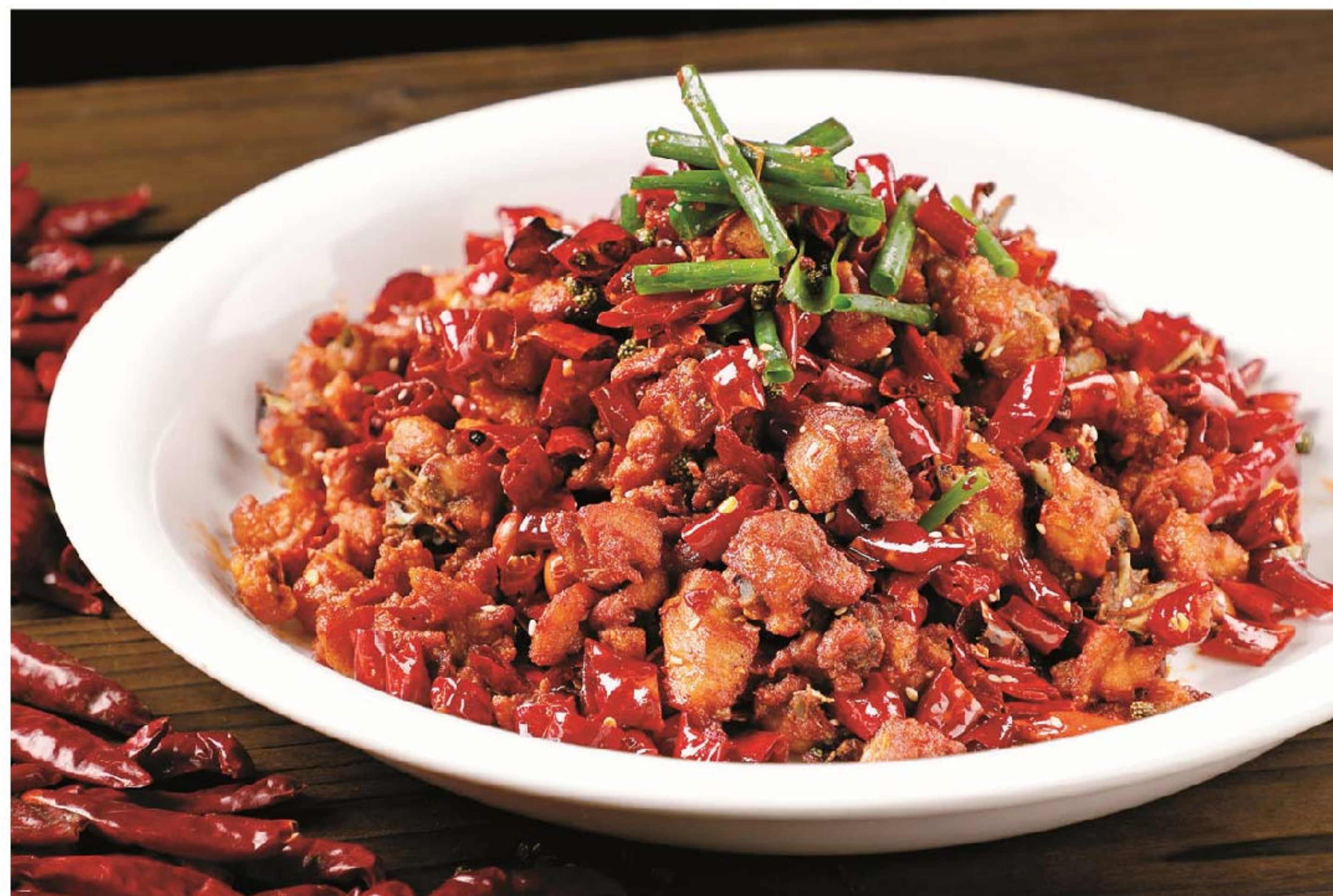
辣子鸡 AYAM CABE KERING RP/ 98k

图片仅供参考·菜品请以实物为准 Harga belum termasuk pajak 10% dan layanan 5%