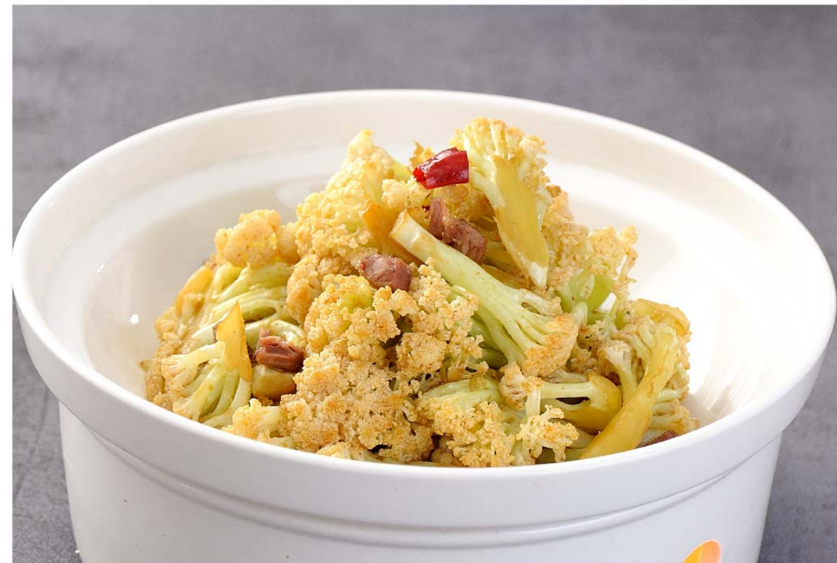
干锅有机花菜 TUMIS KEMBANG KOL RP/68k