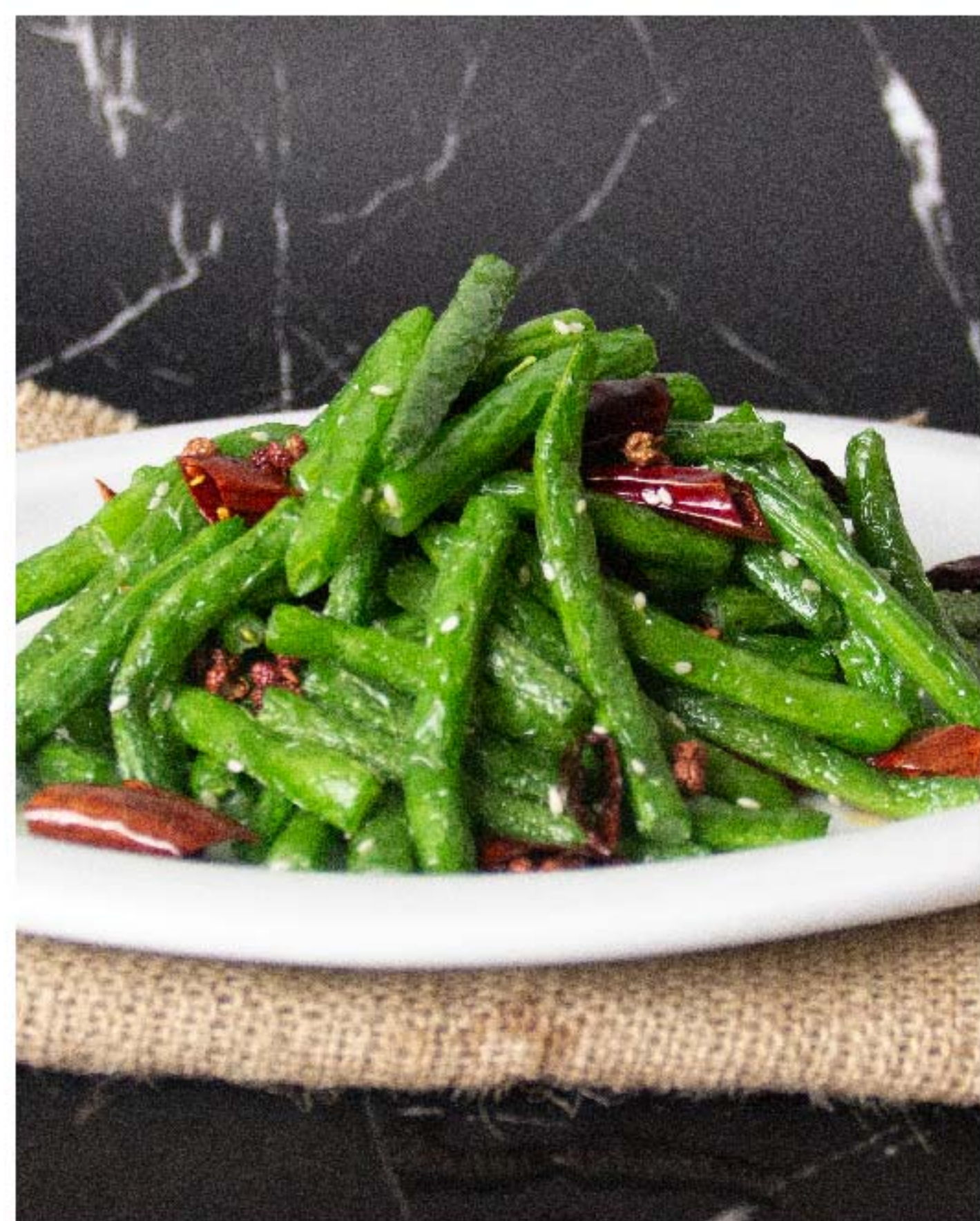
干煸四季豆 BUNCIS SECHUAN RP/56k