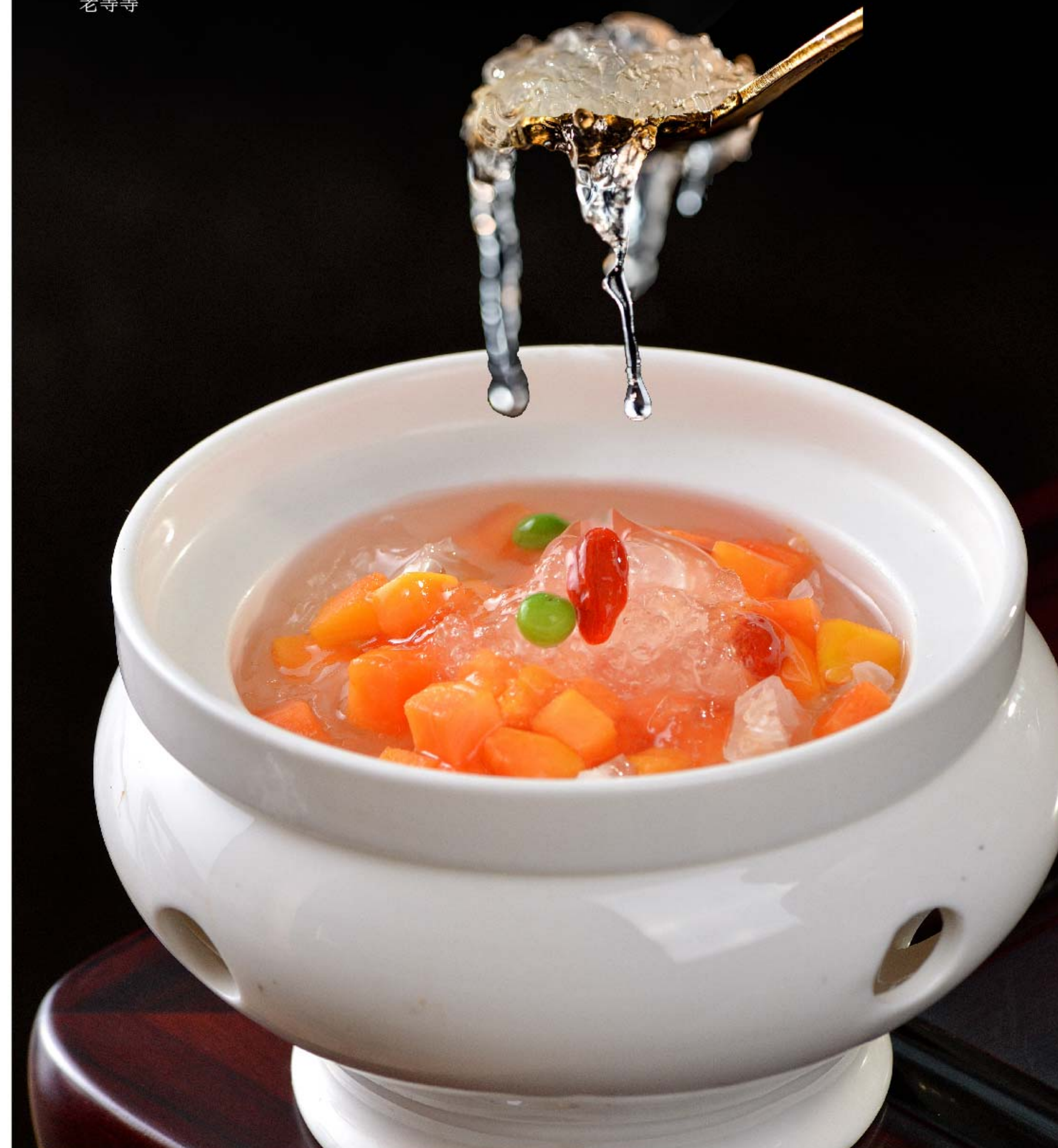
鲜炖燕窝 SUP WALET RP/ 198k (位)

全球燕窝市场中约80%的产量来自印尼， 是当之无愧的世界第一 主要功效是，滋阴润肺、养颜美容、增 强免疫力，现代营养学发现其富含唾液 酸和蛋白质，对大脑发育和皮肤抗衰 老等等