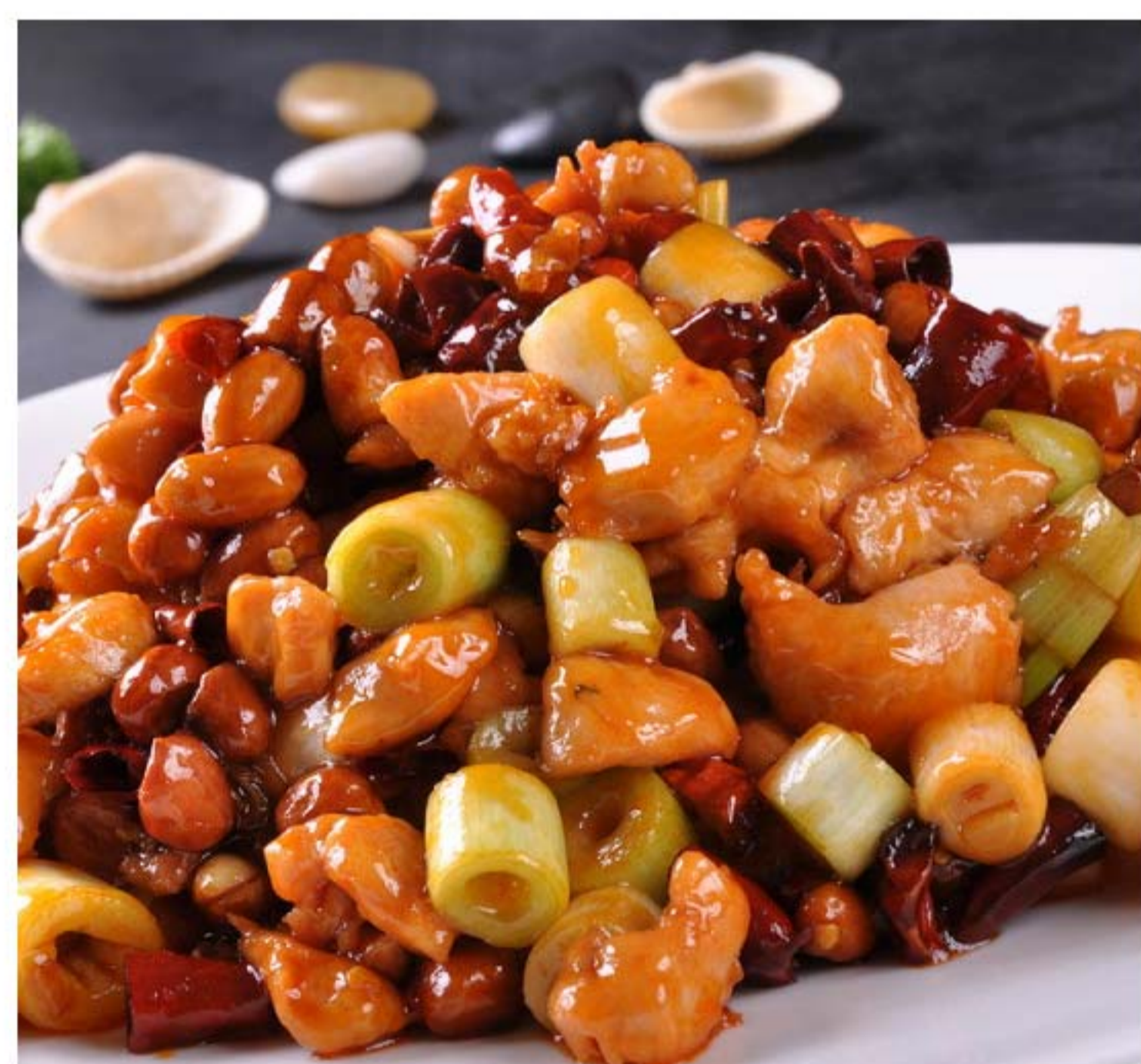
官爆鸡丁 AYAM KONG PAO RP/118k