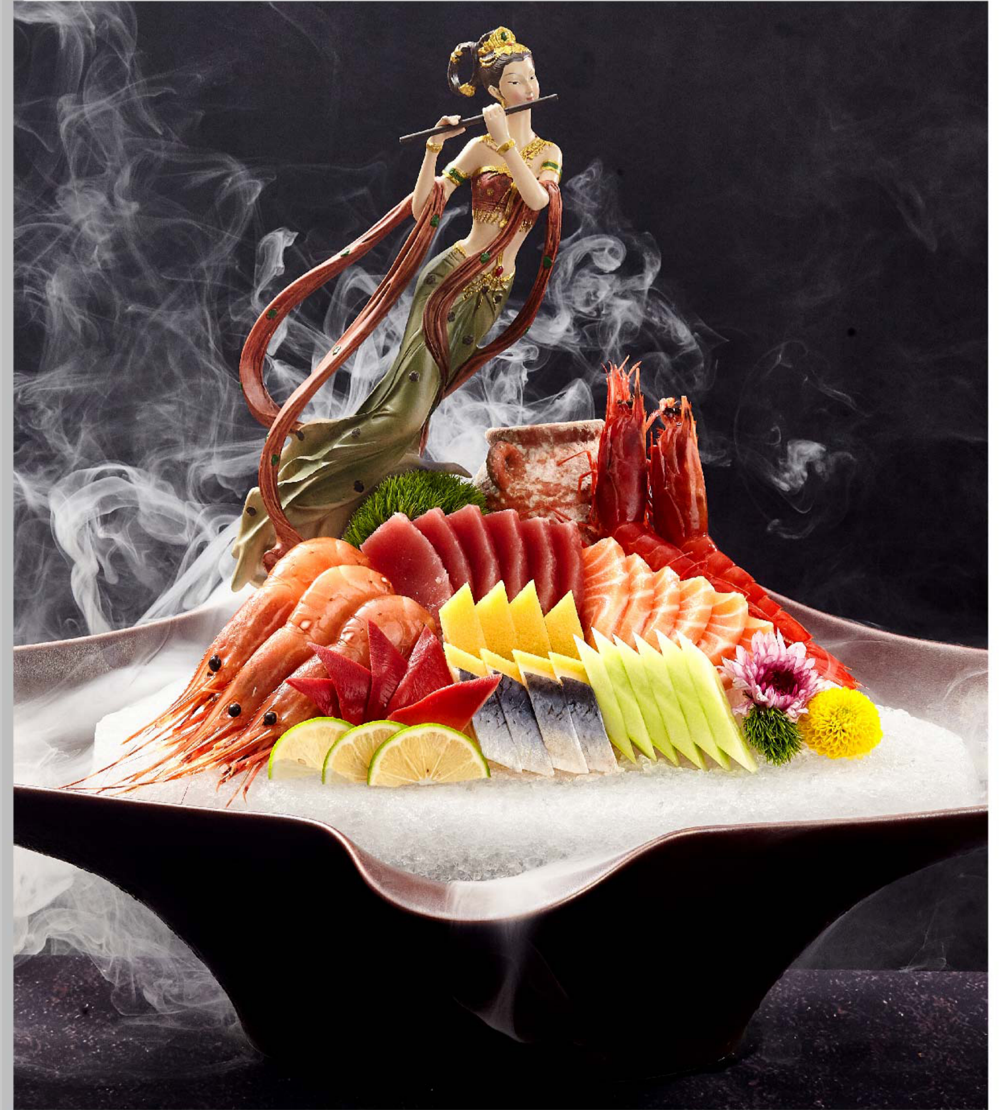
刺身拼盘 SHASIMI TUNA KOMBINASI RP/698k