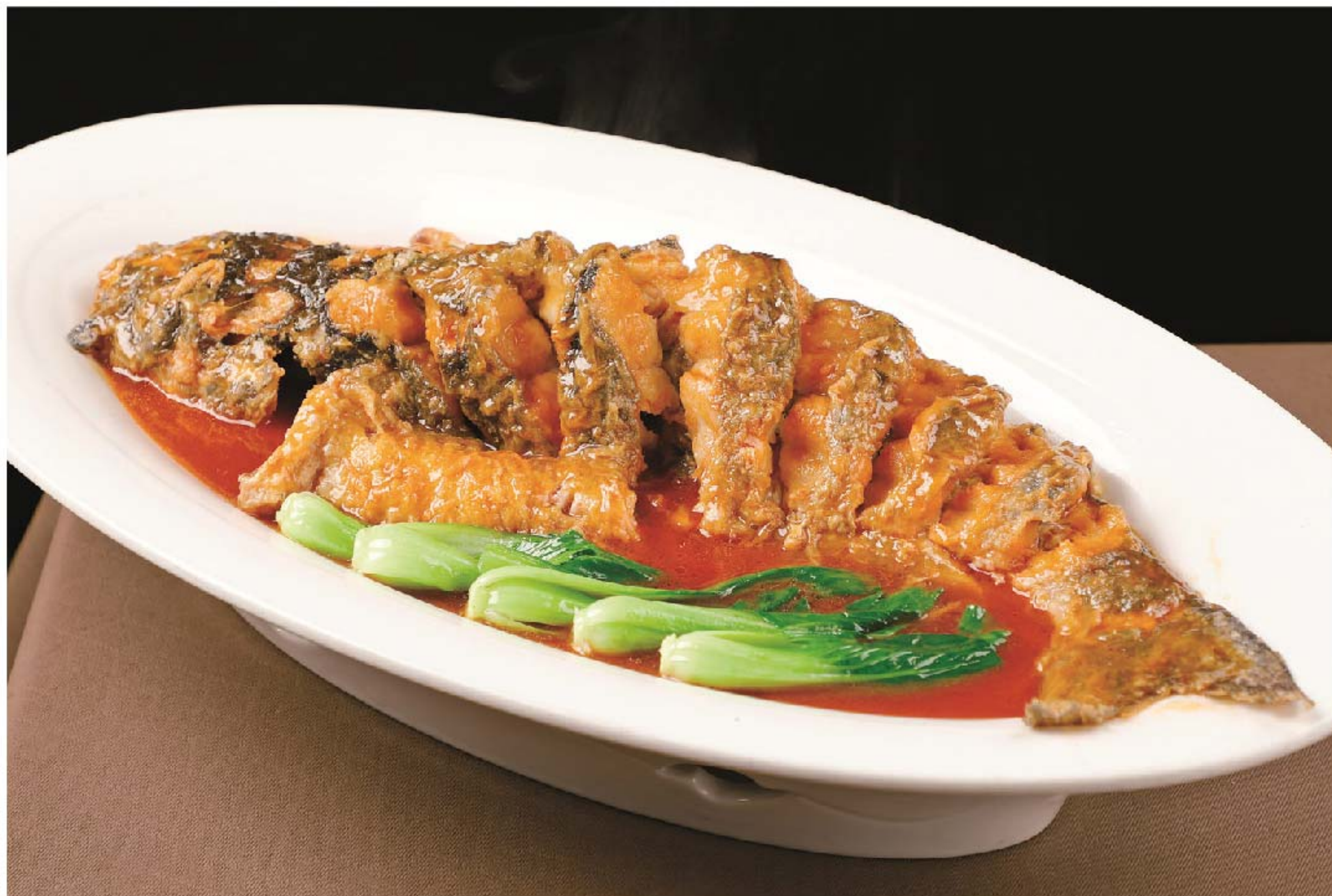
红烧巴丁鱼 IKAN PATIN ANGSIO RP/198k

图片仅供参考·菜品请以实物为准 Harga belum termasuk pajak 10% dan layanan 5%