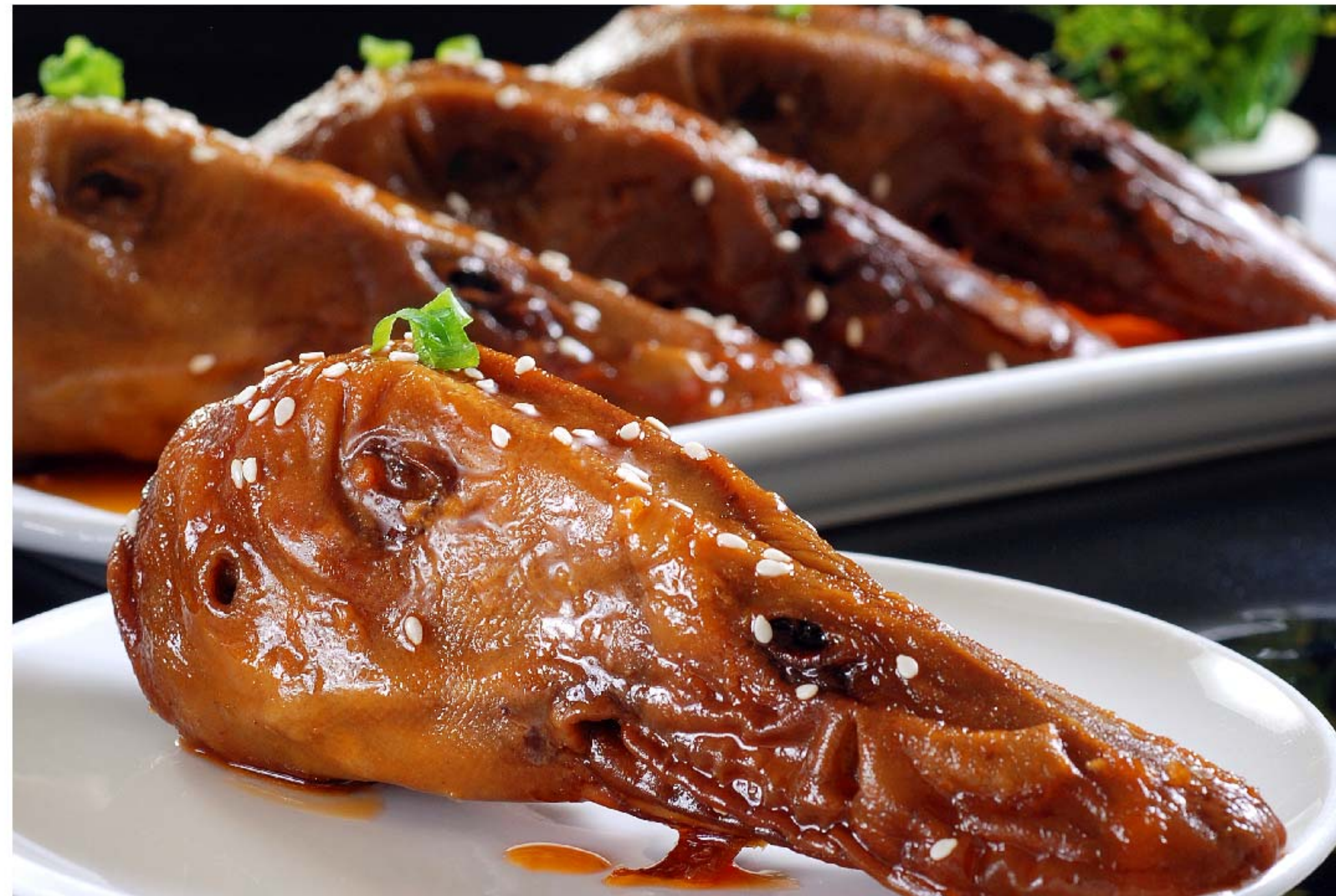
麻辣鸭头 BEBEK.KEPALA MALA RP/20k (3个起售)