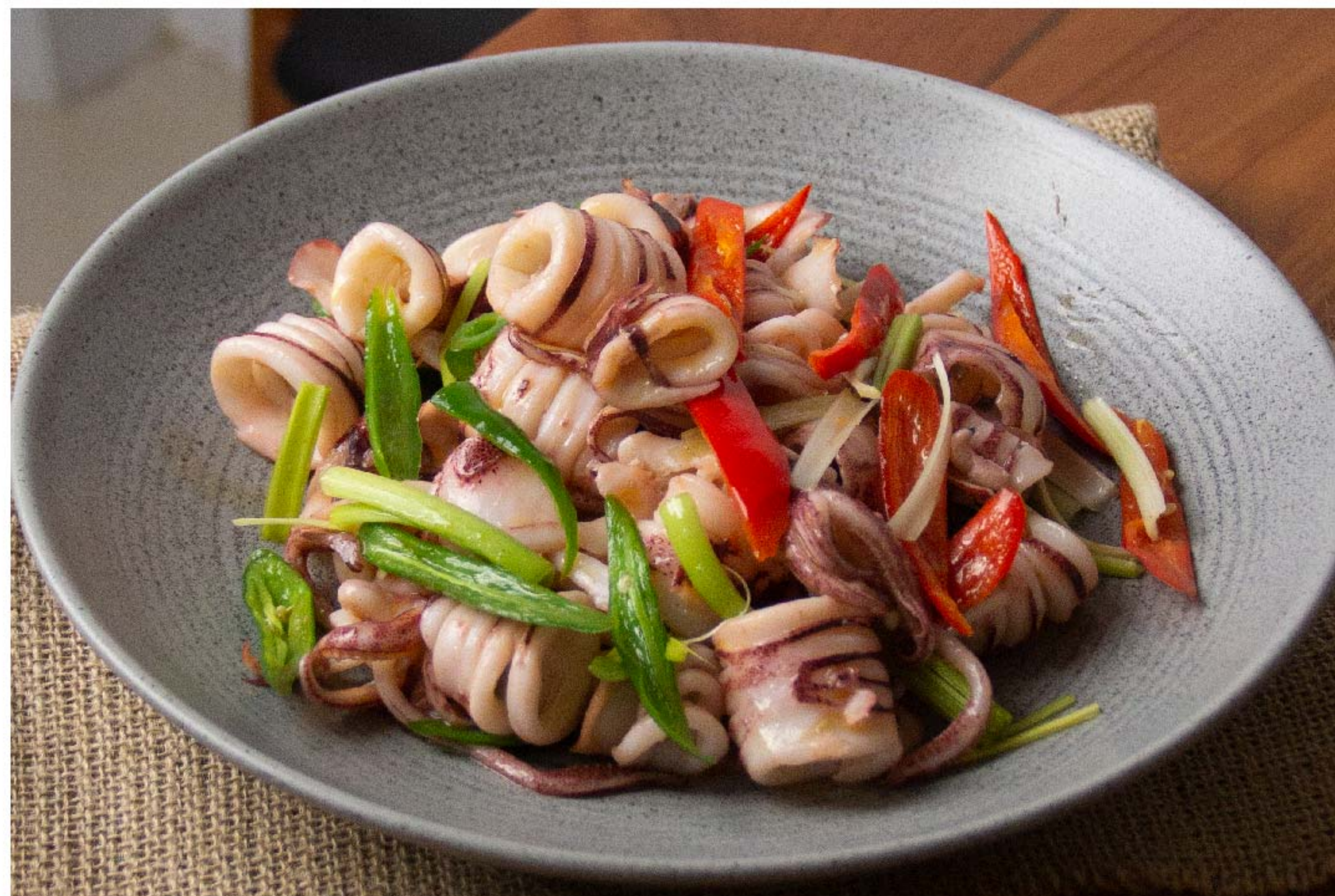
爆炒印尼鲜鱿鱼 CUMI TUMIS PEDAS RP/ 138k