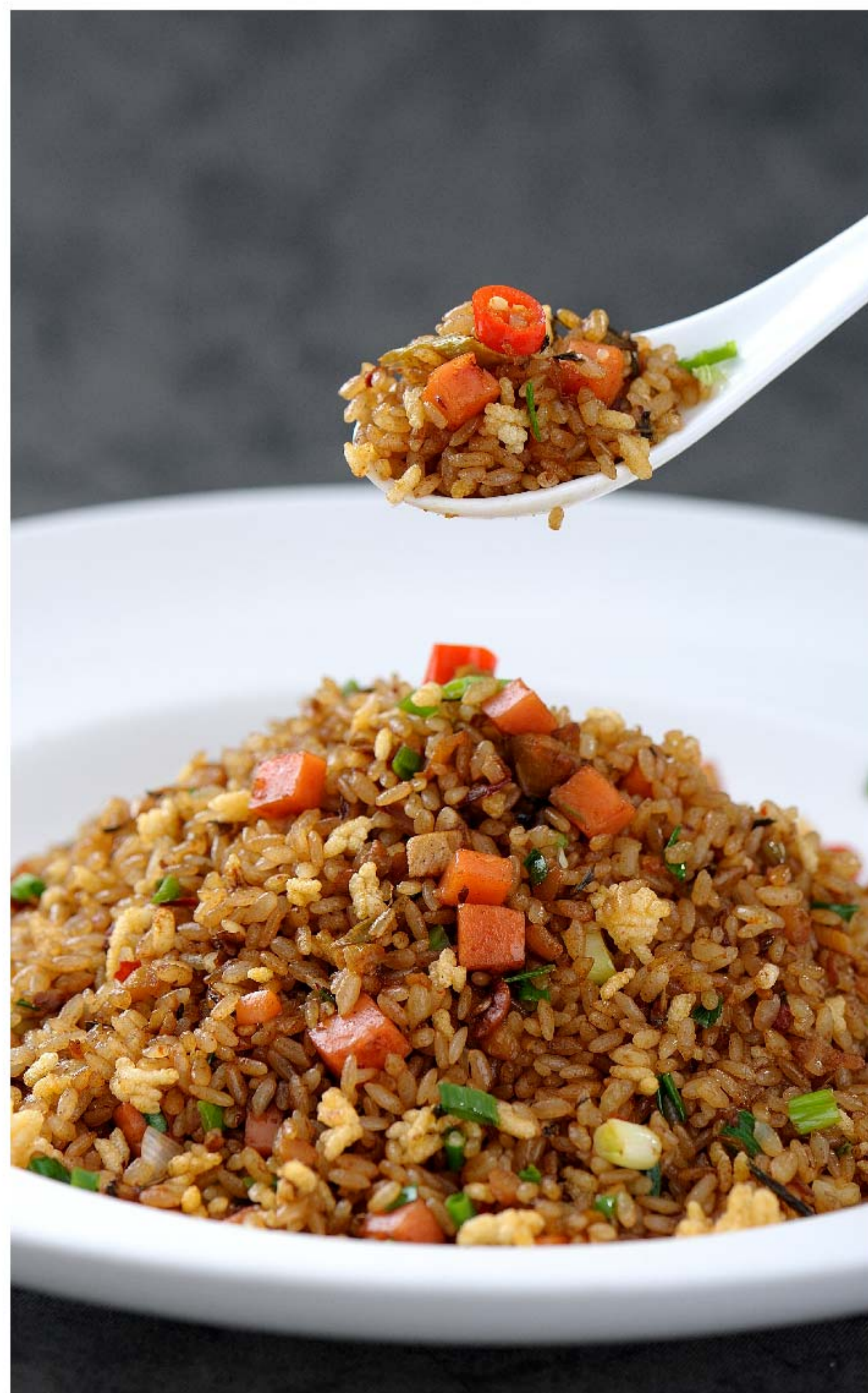
扬州炒饭 NASI GORENG YANGZHOU RP/39k