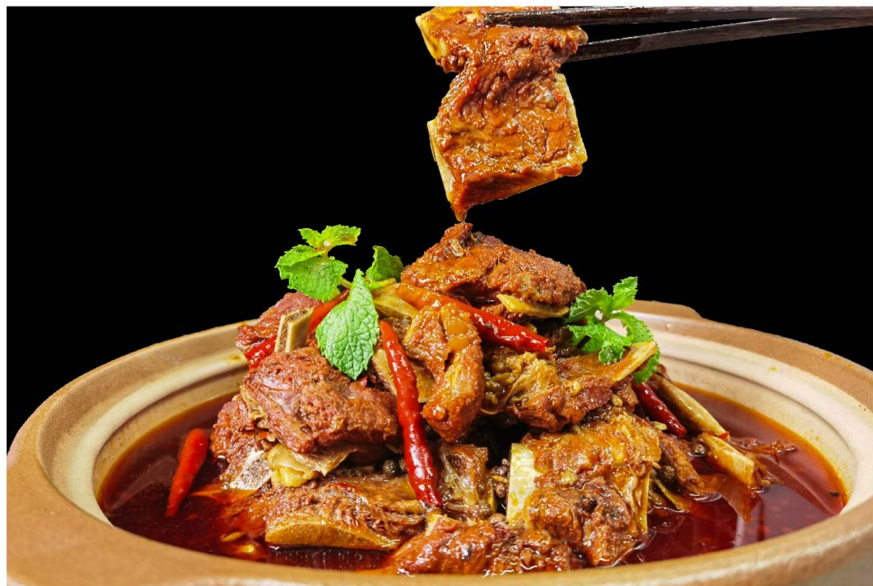
香辣牛排 SAPI IGA MALA RP/228k