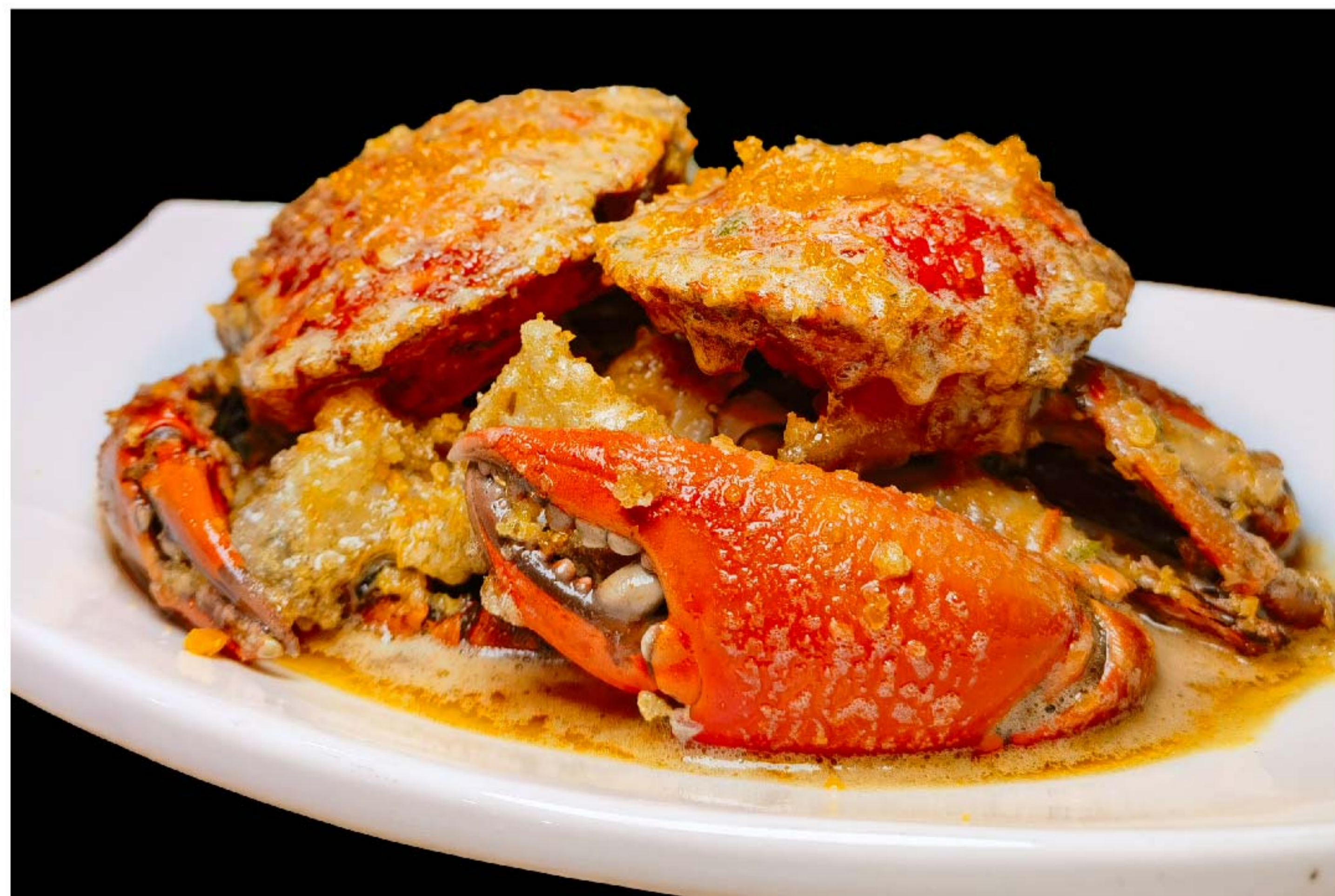
黄油咸蛋炒蟹 KEPITING TELUR ASIN RP/时价

图片仅供参考·菜品请以实物为准 Harga belum termasuk pajak 10% dan layanan 5%