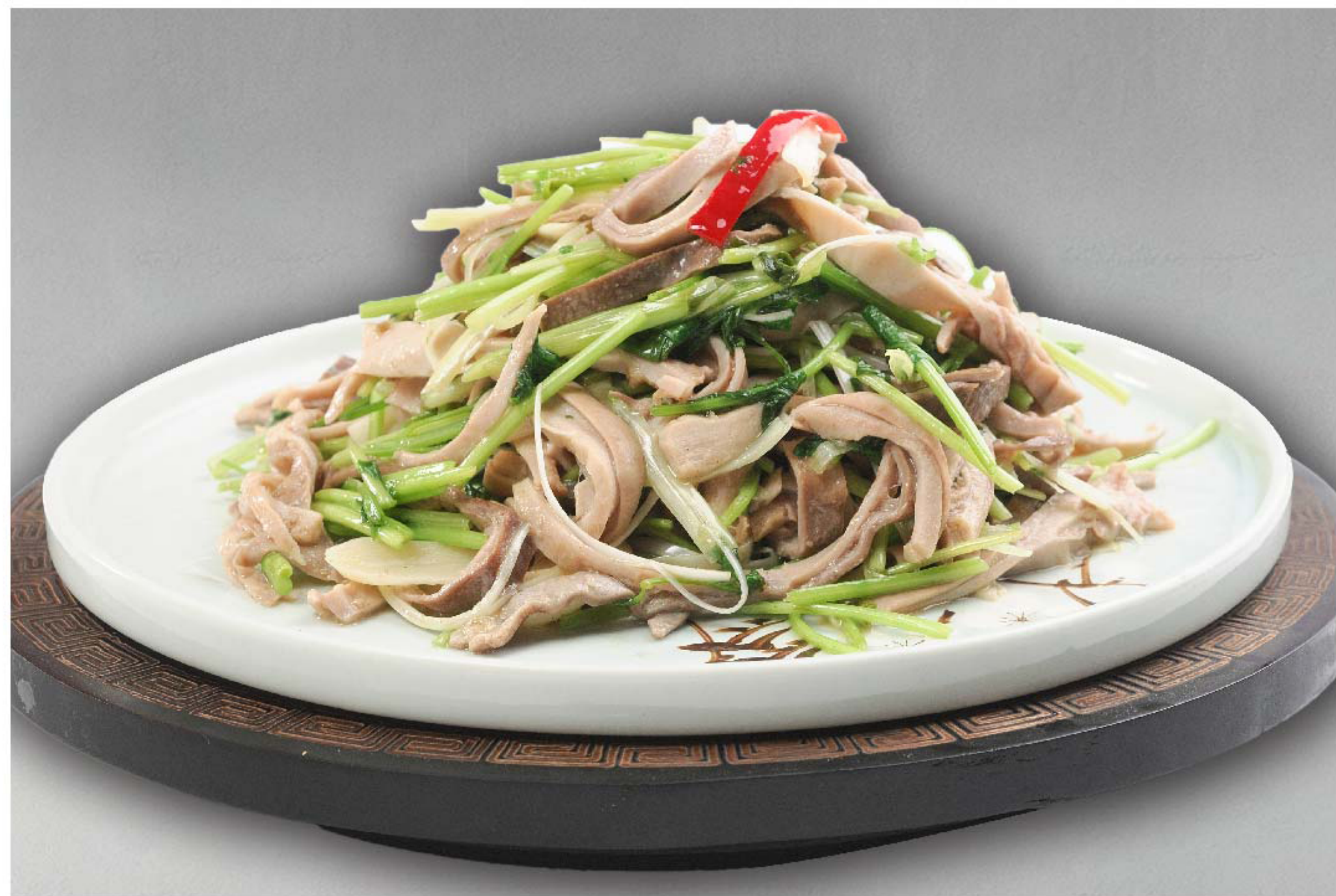
爆炒肚丝 PERUT BABI TUMIS RP/ 168k