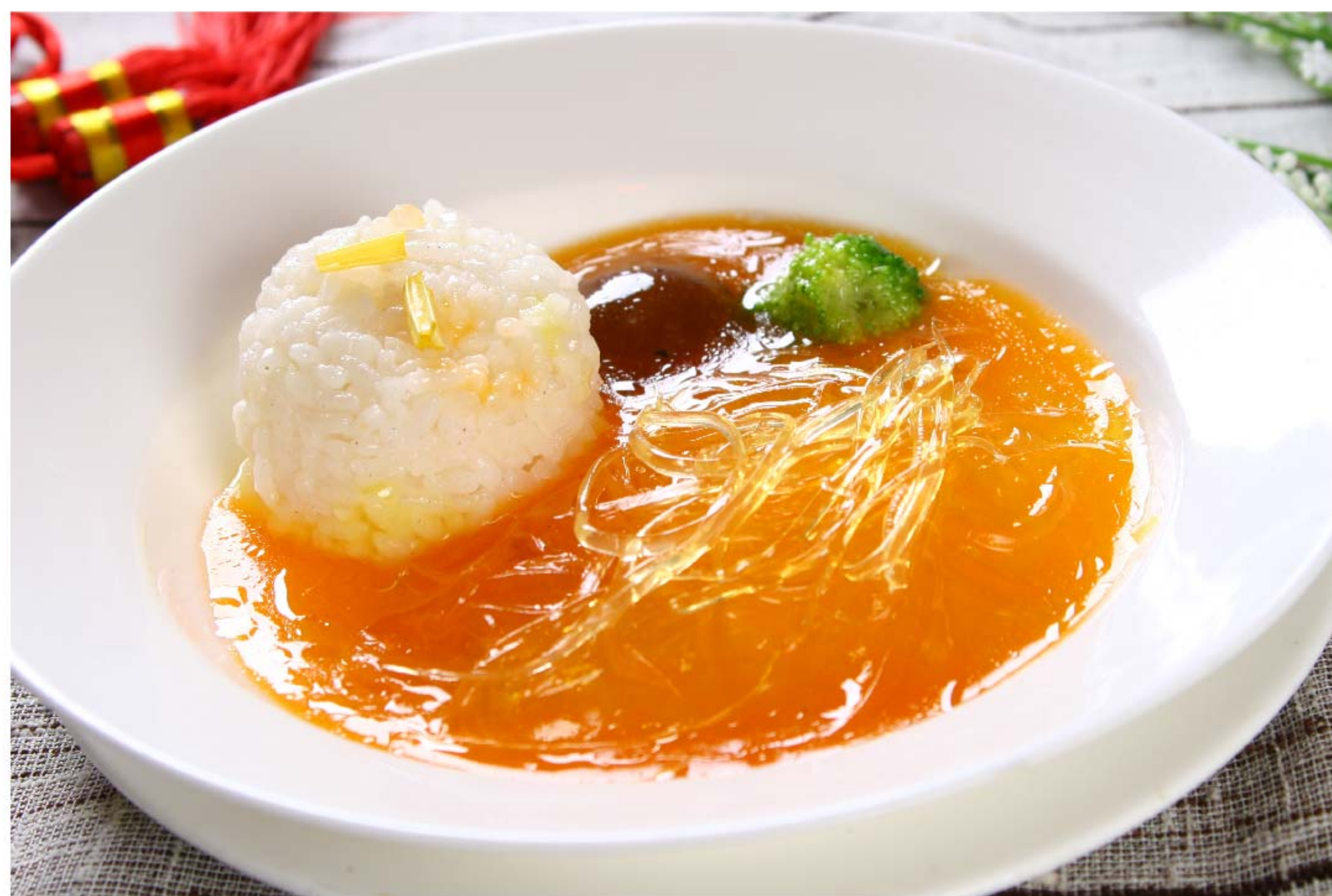
鱼翅捞饭 ANGSIO SIRIP HIU RP/198k (位)

图片仅供参考·菜品请以实物为准 Harga belum termasuk pajak 10% dan layanan 5%