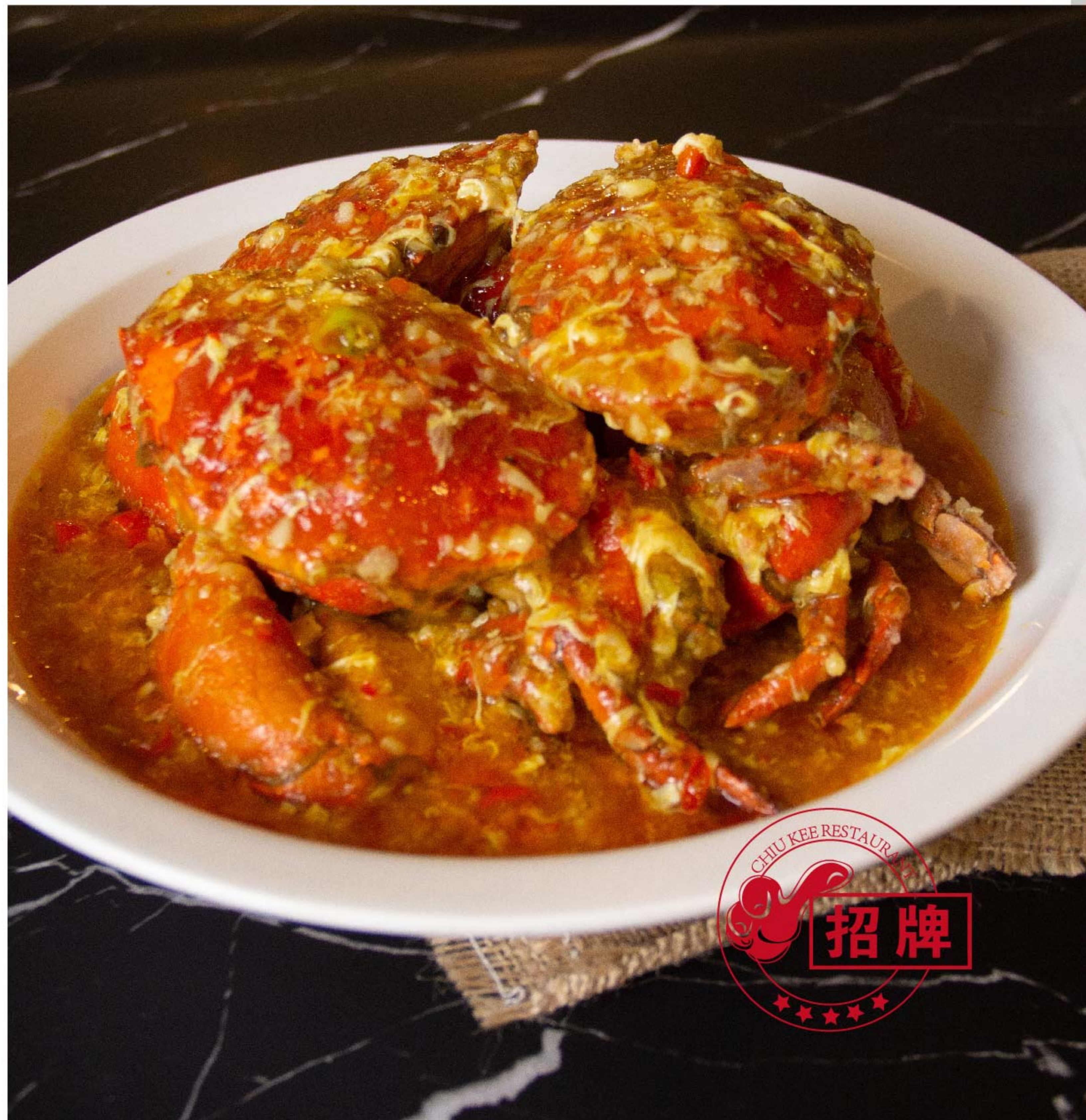
招牌巴东酱炒蟹 KEPITING SAOS PADANG RP/时价

图片仅供参考·菜品请以实物为准 Harga belum termasuk pajak 10% dan layanan 5%