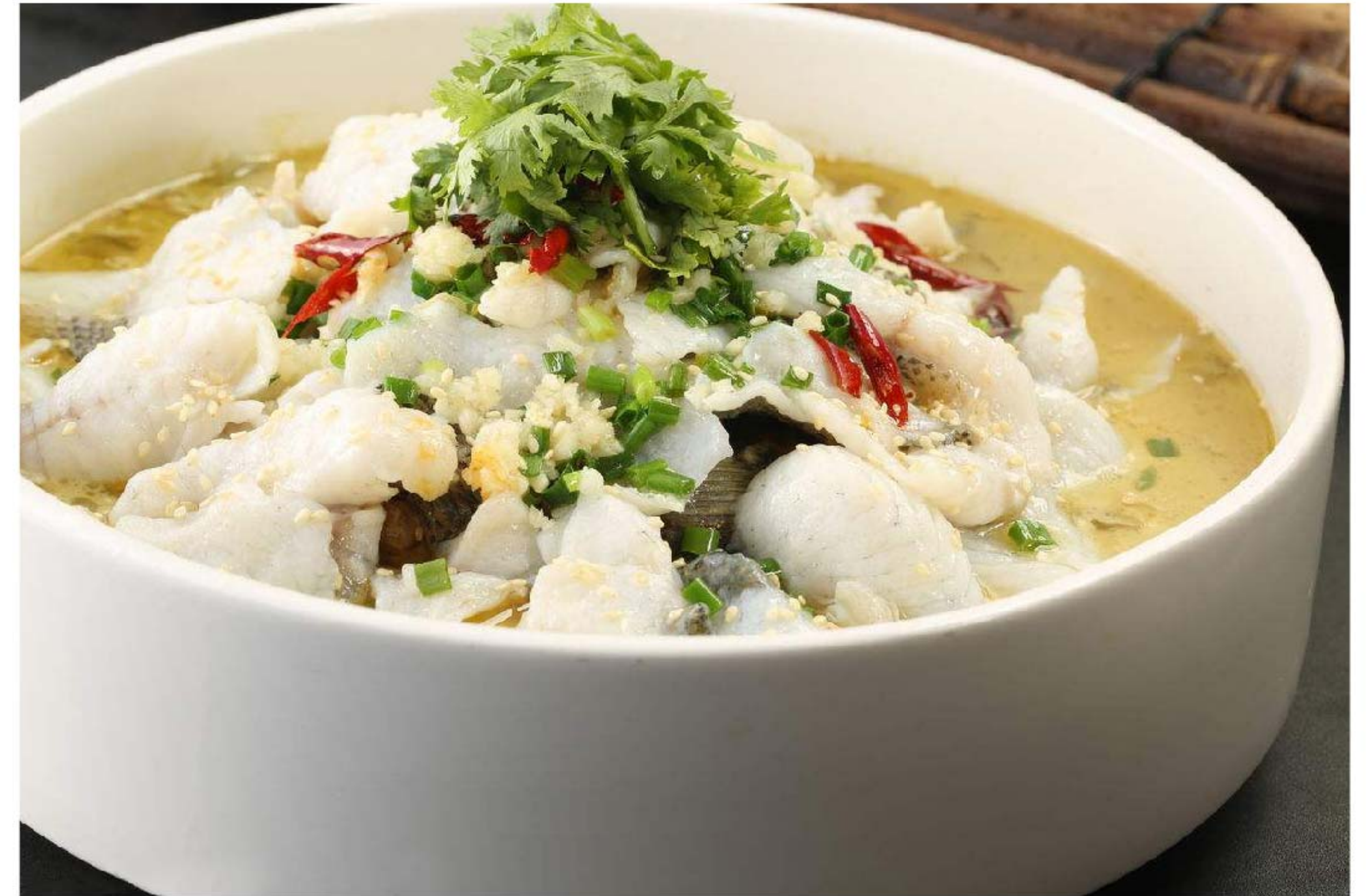
邱记酸菜鱼 IKAN SAYUR ASIN RP/198k