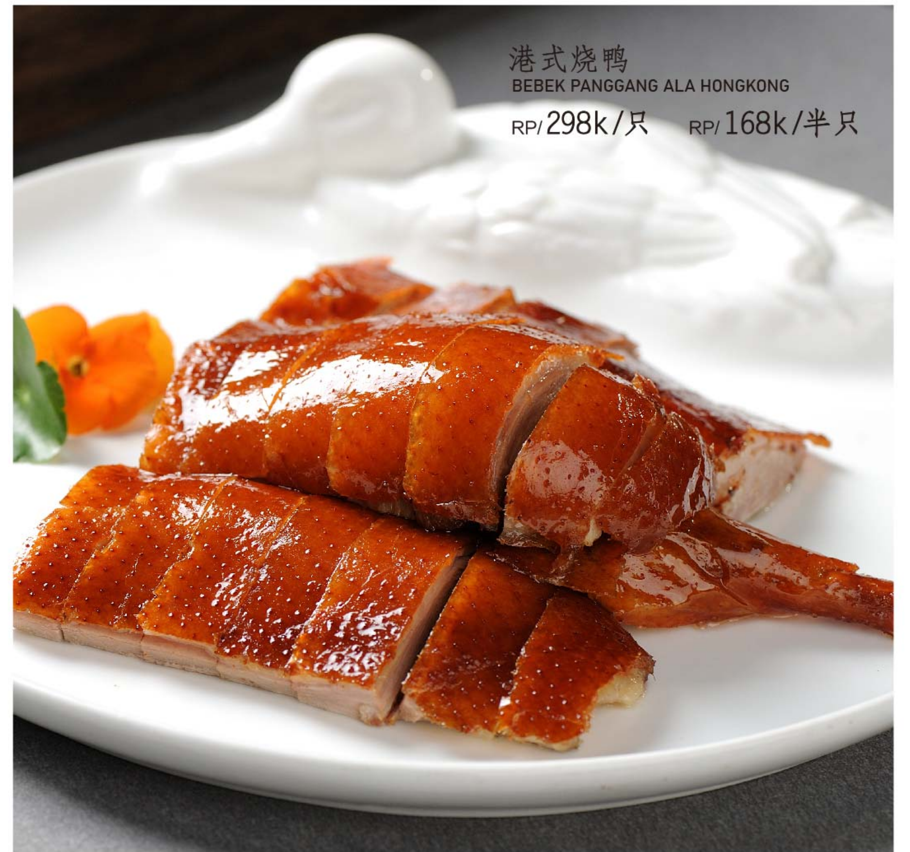
港式烧鸭 BEBEK PANGGANG ALA HONGKONG RP/298k/只 RP/168k/半只

图片仅供参考·菜品请以实物为准 Harga belum termasuk pajak 10% dan layanan 5%