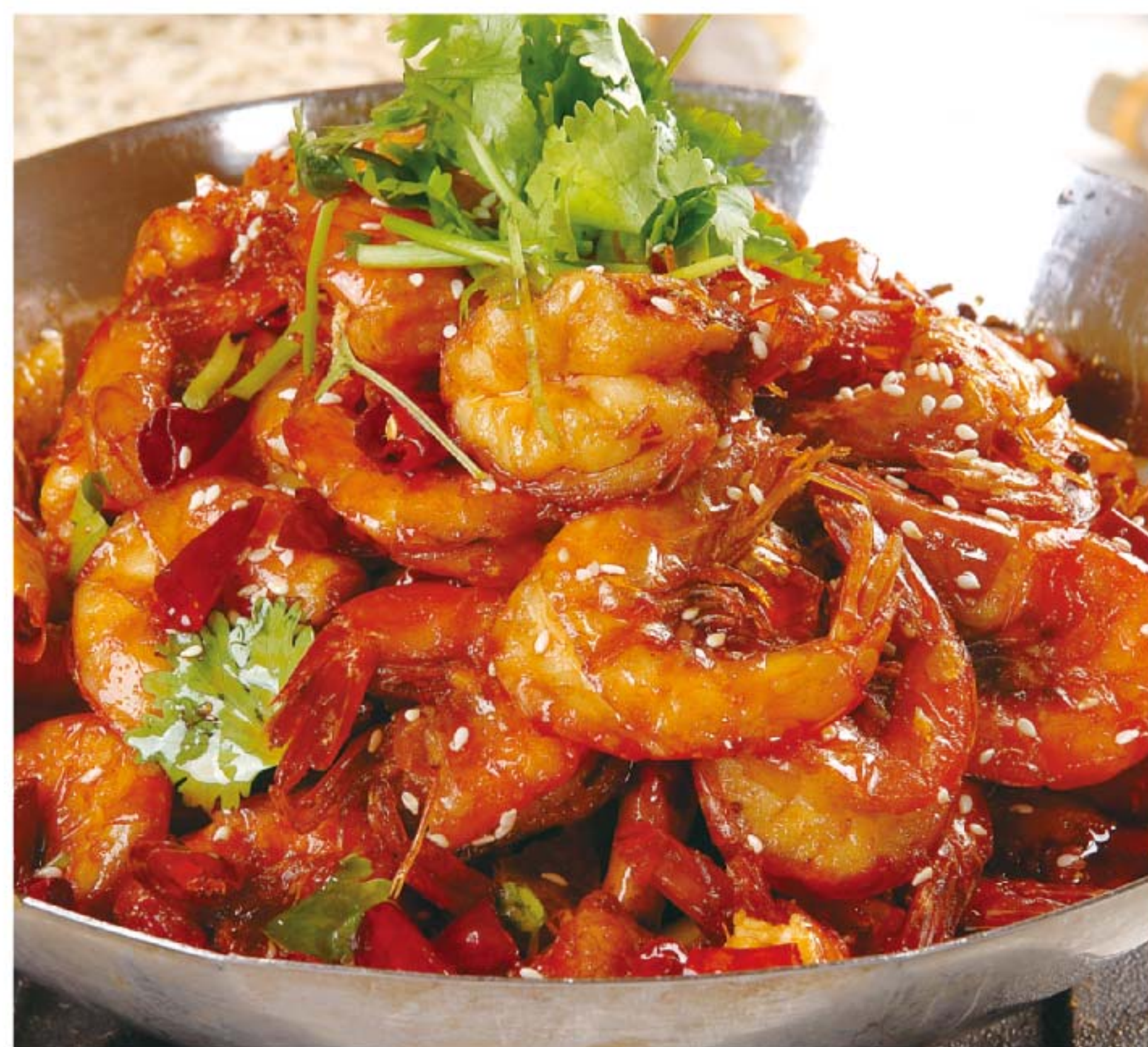
香辣虾 UDANG TUMIS MALA RP/ 188k

图片仅供参考·菜品请以实物为准 Harga belum termasuk pajak 10% dan layanan 5%