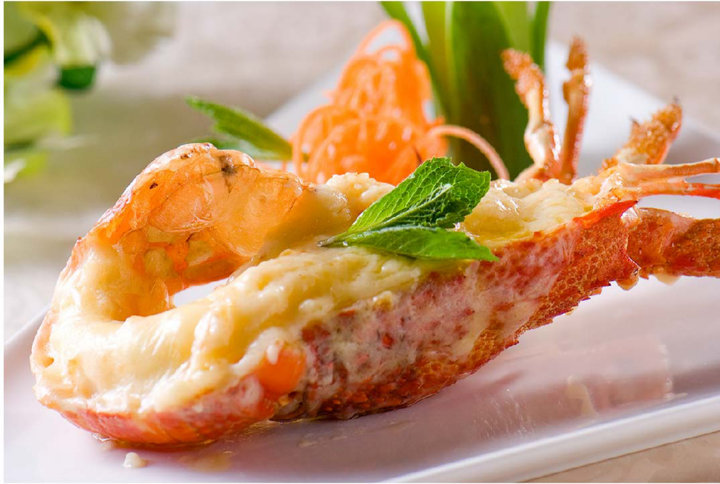
香草芝士焗龙虾 LOBSTER KEJU PANGGANG RP/时价