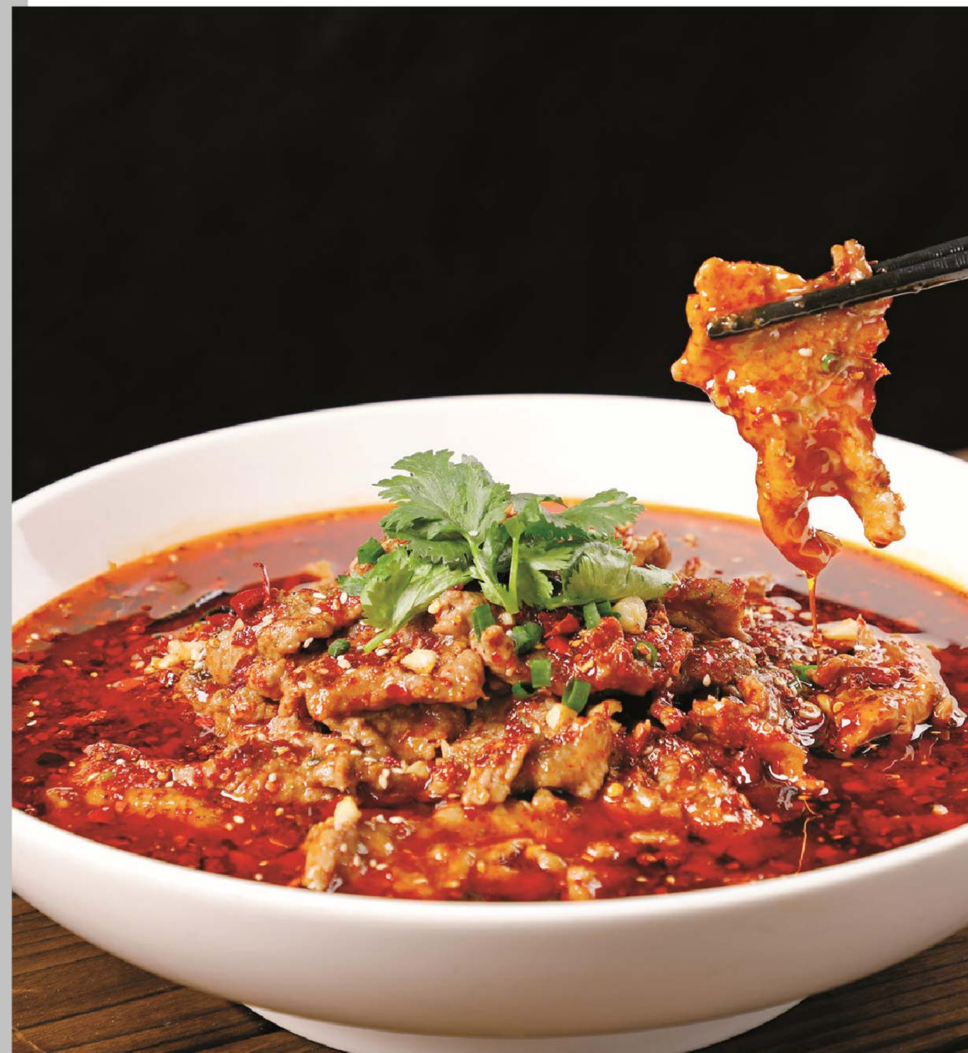
水煮牛肉 SAPI KUAH MALA RP/198k

图片仅供参考·菜品请以实物为准 Harga belum termasuk pajak 10% dan layanan 5%