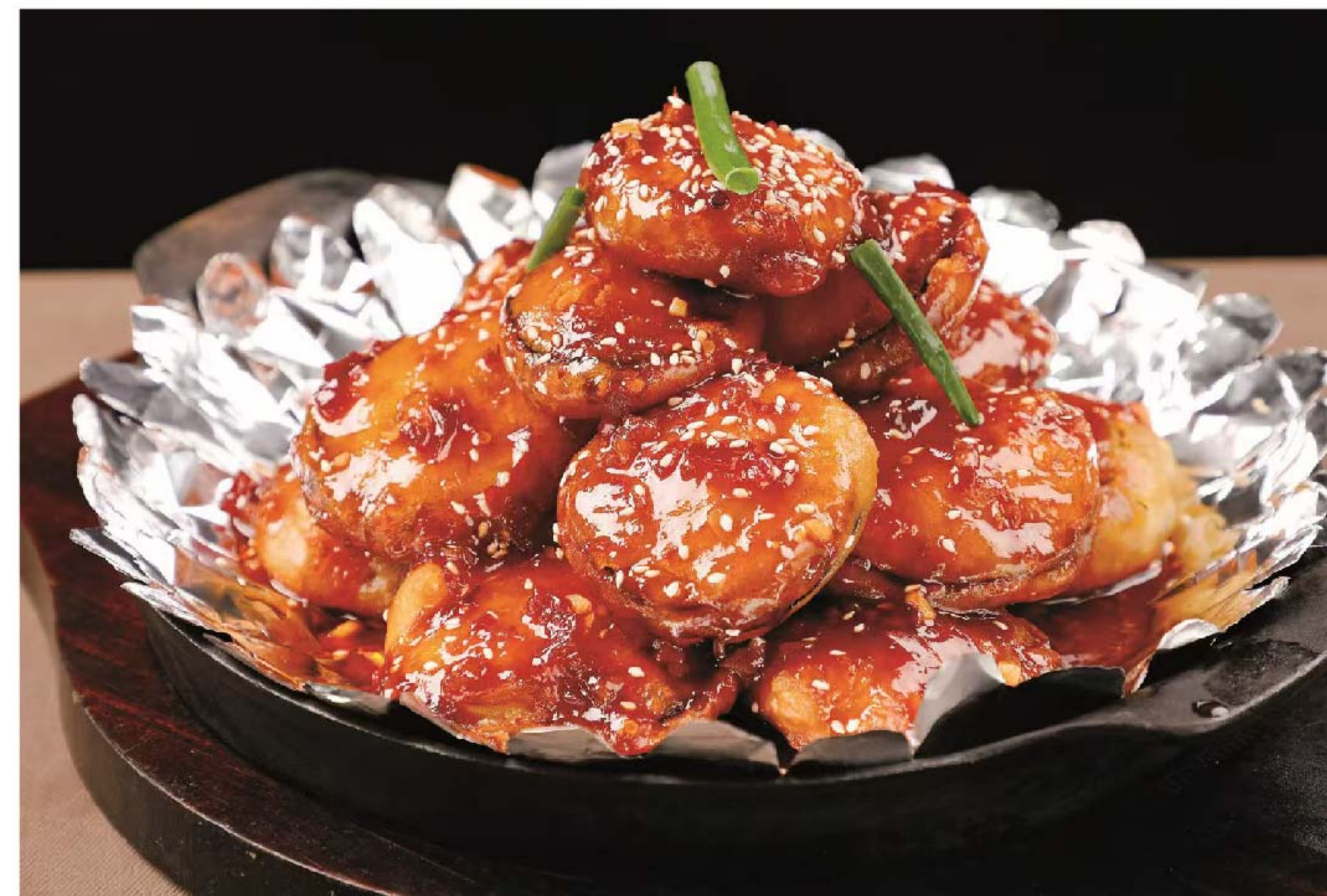
鱼香酿茄盒 TERONG GORENG ISI DAGING RP/68k