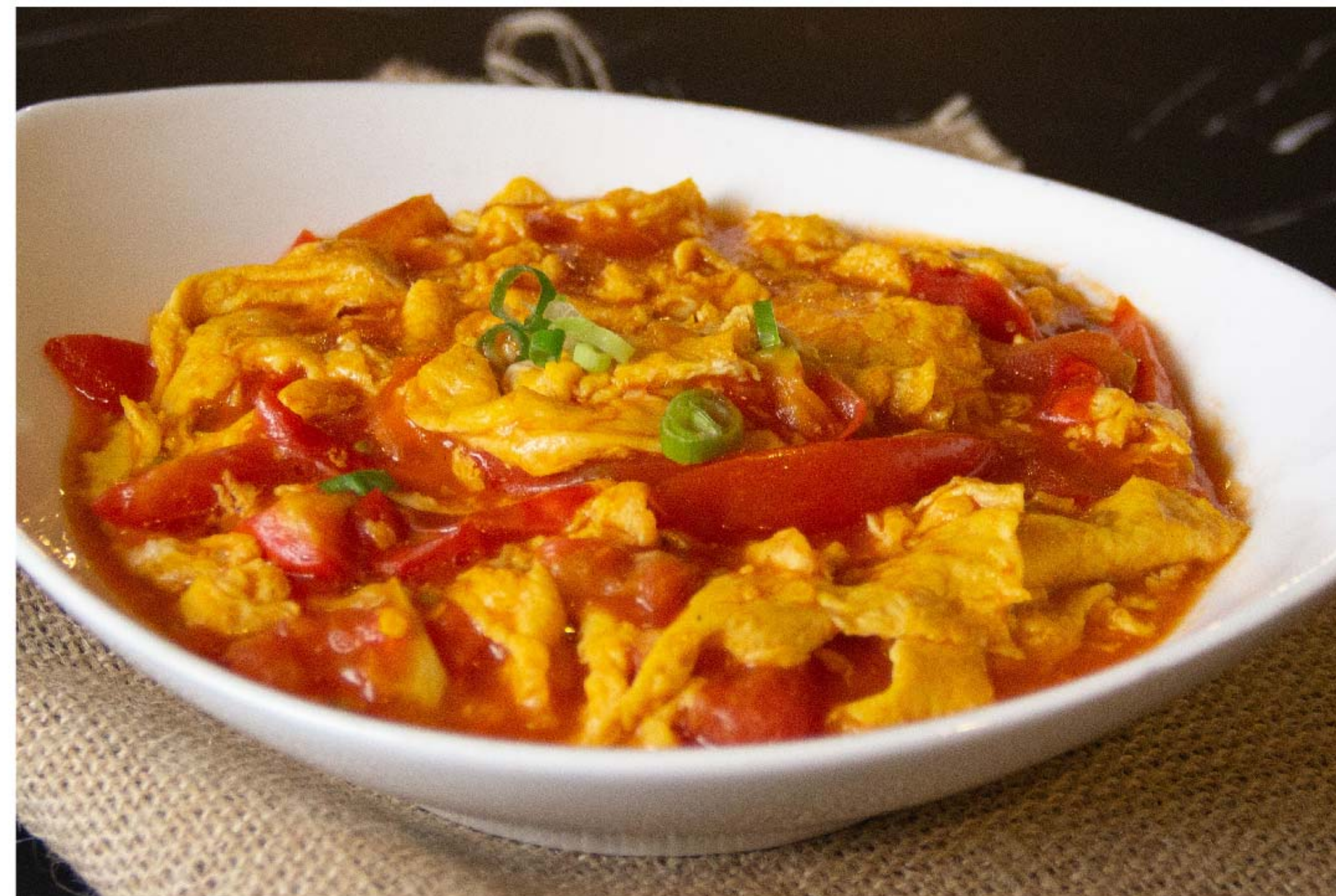
番茄炒蛋 TELUR TOMAT RP/58k