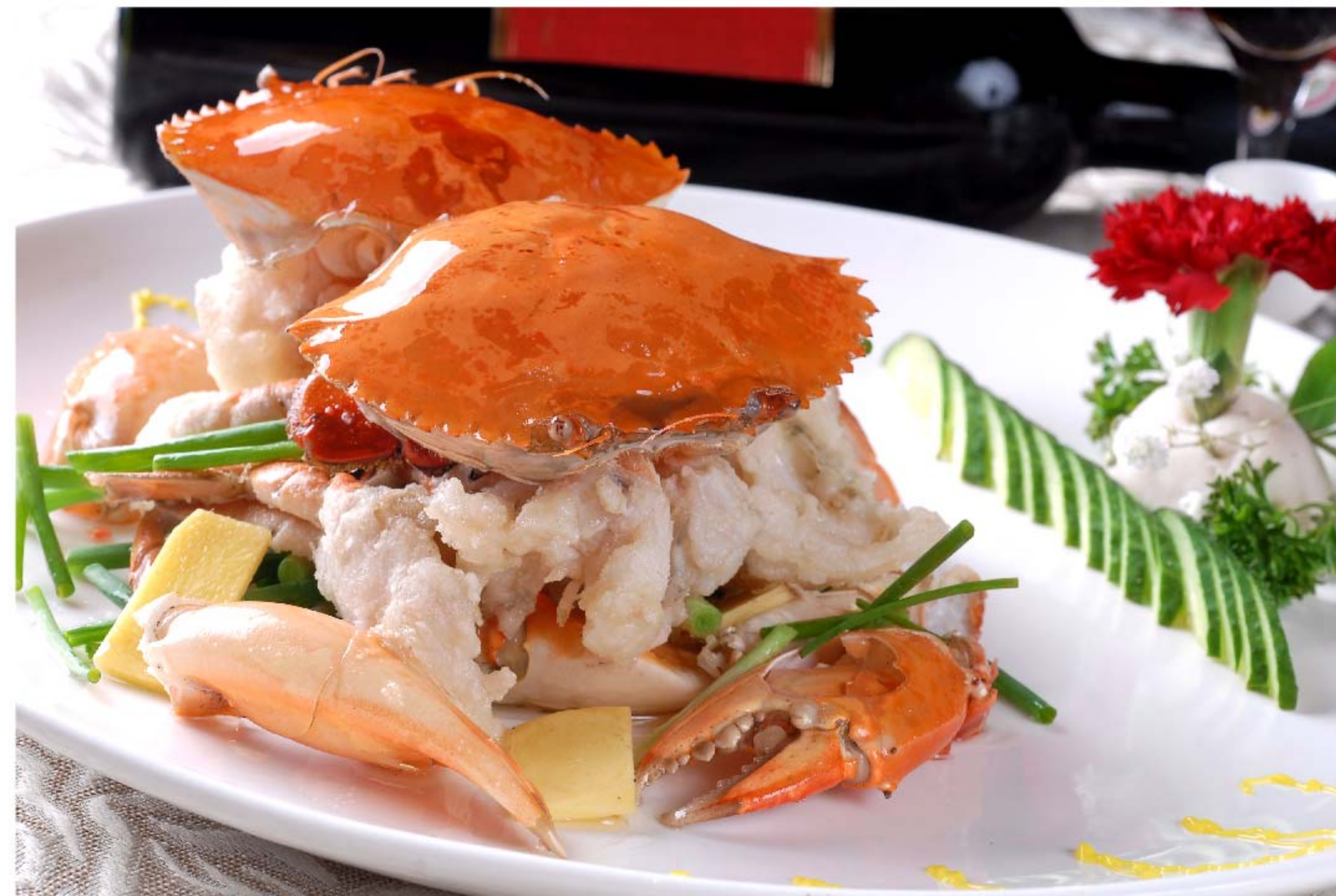
港式葱姜肉蟹 KEPITING JAHE BAWANG RP/时价