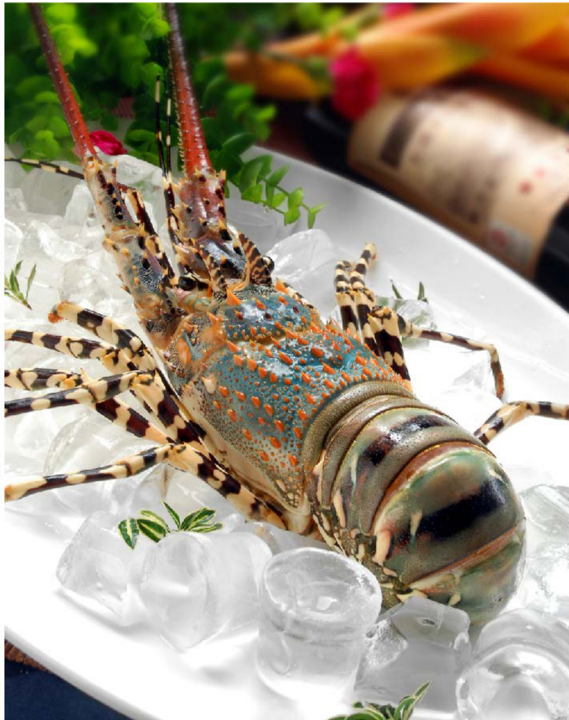
刺身大龙虾 LOBSTER SASHIMMI RP/时价

图片仅供参考·菜品请以实物为准 Harga belum termasuk pajak 10% dan layanan 5%