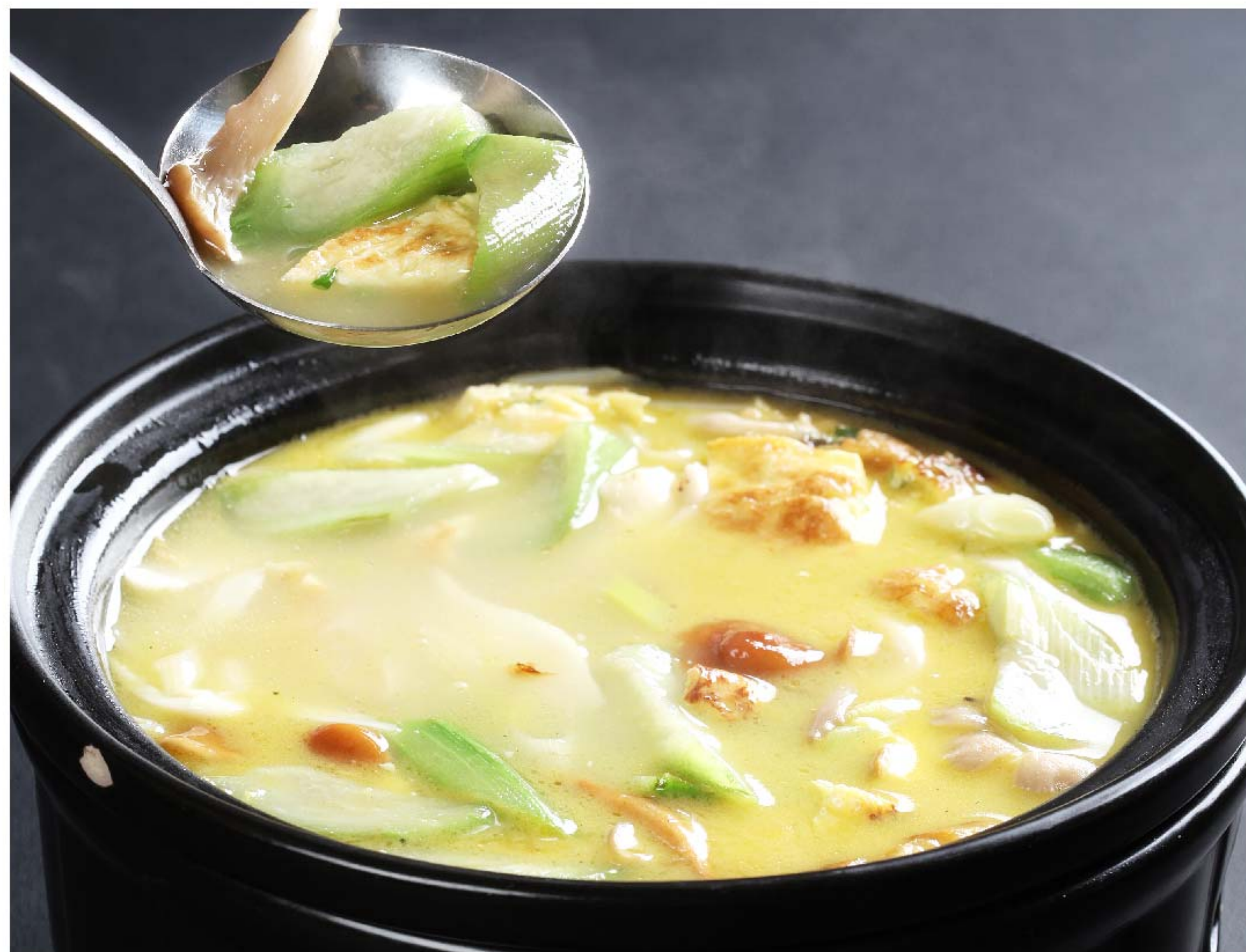
丝瓜烩三鲜 KUAH TELUR GAMBAS RP/66k