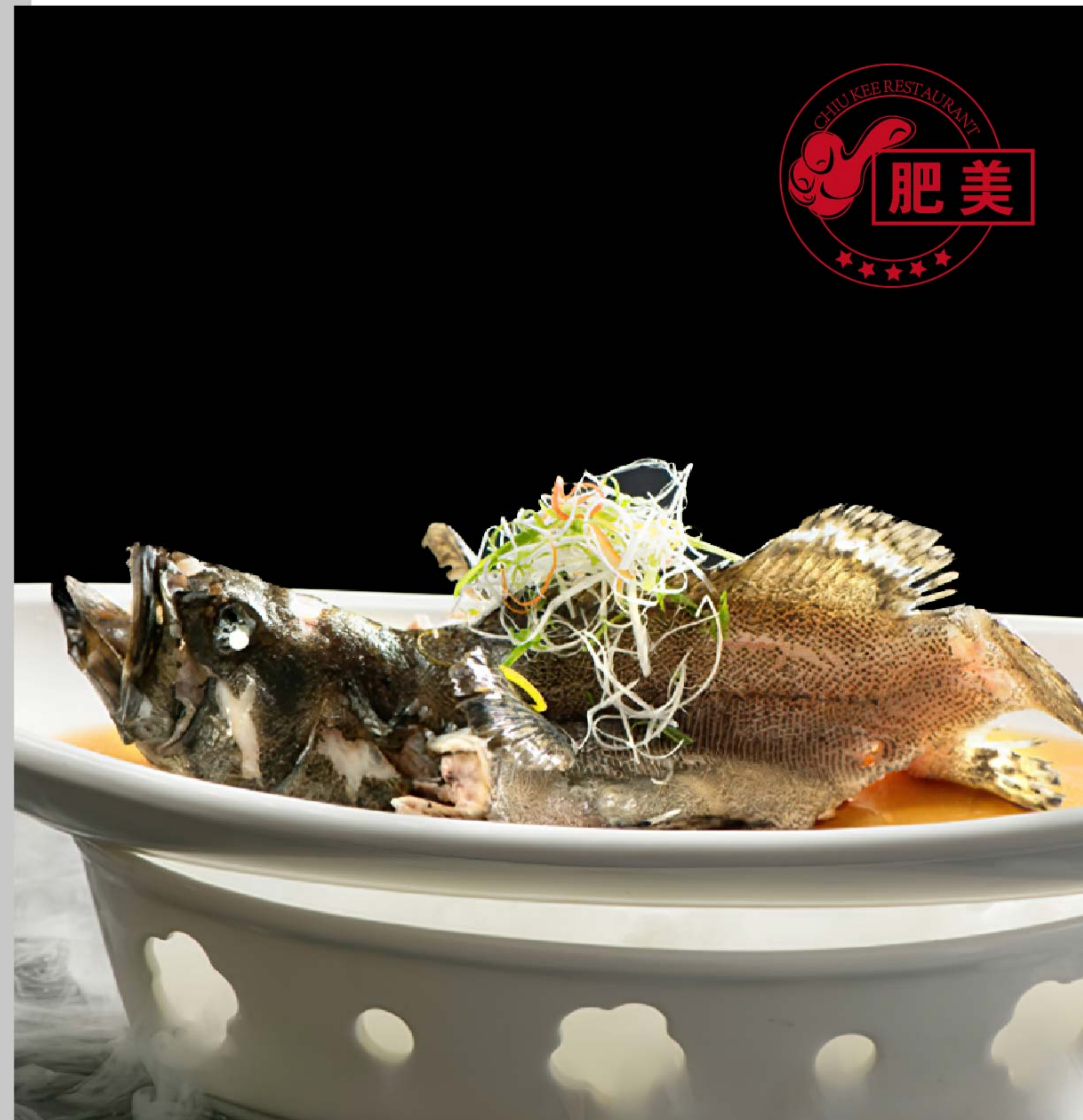
港式清蒸石斑鱼 IKAN STEAM HONGKONG RP/时价

图片仅供参考·菜品请以实物为准 Harga belum termasuk pajak 10% dan layanan 5%