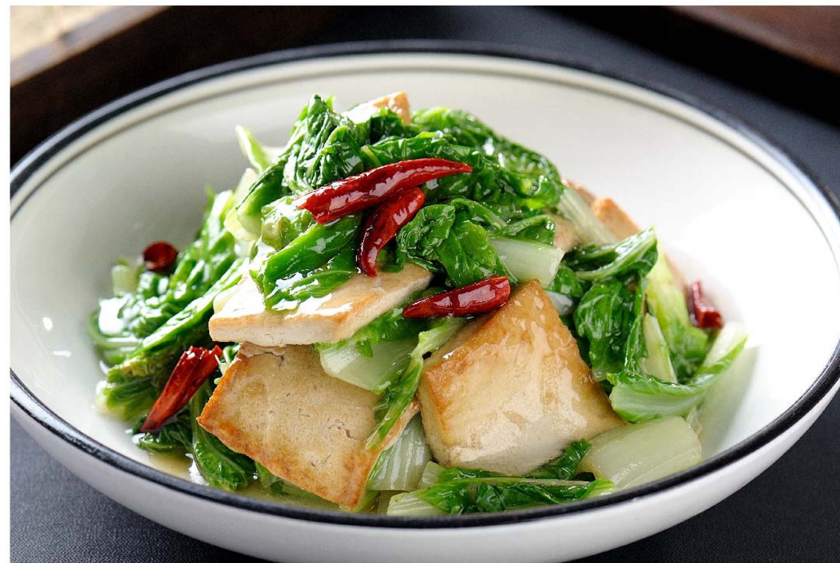
青菜煎豆腐 POKCOY TUMIS TAHU RP/58k

图片仅供参考·菜品请以实物为准 Harga belum termasuk pajak 10% dan layanan 5%