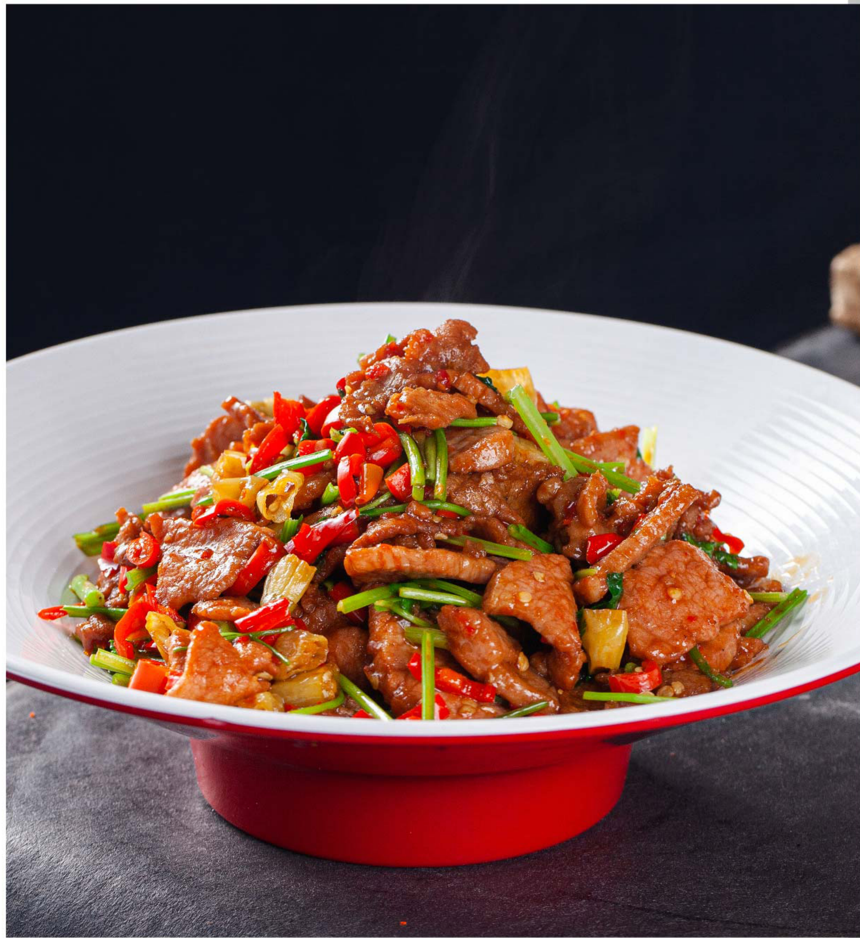
小炒黄牛肉 SAPI TUMIS PEDAS RP/ 158k