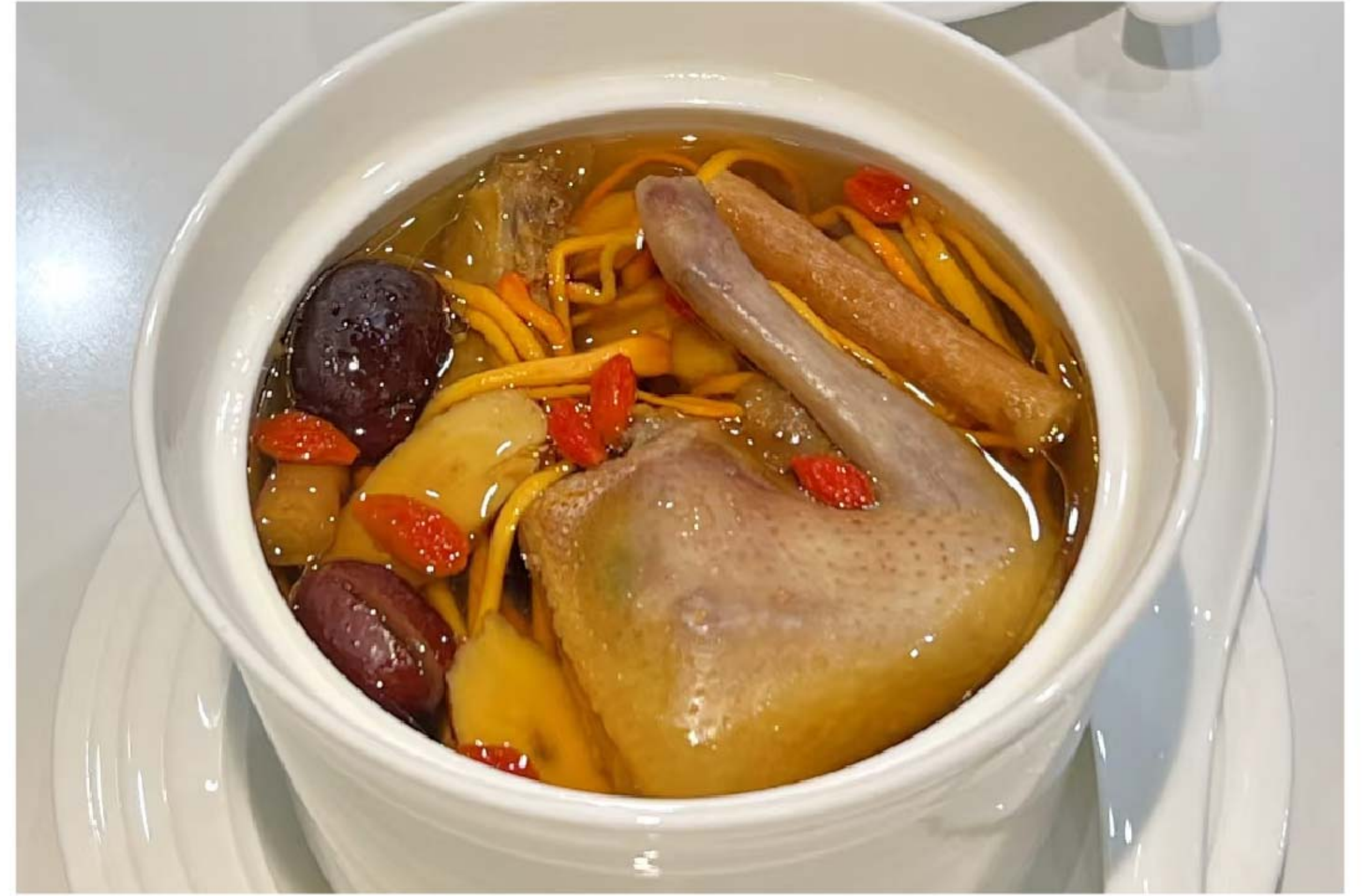
菌香鸽子汤 SUP JAMUR BURUNG DARA RP/68k (位)