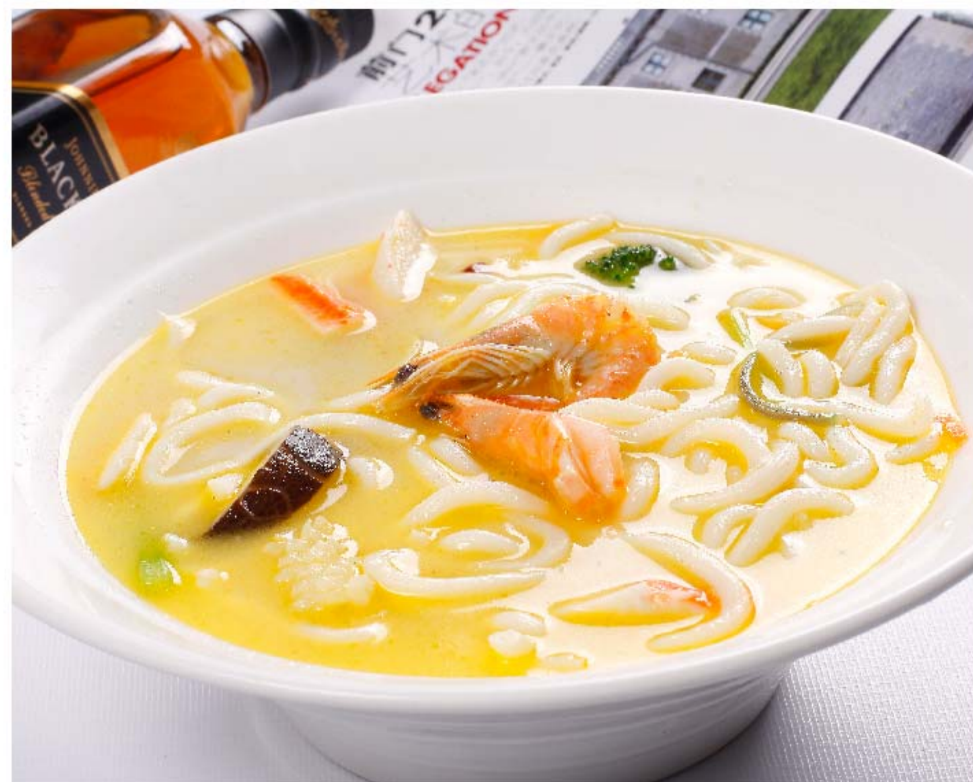
海鲜炆锅面 MIE KUAH SEAFOOD RP/48k