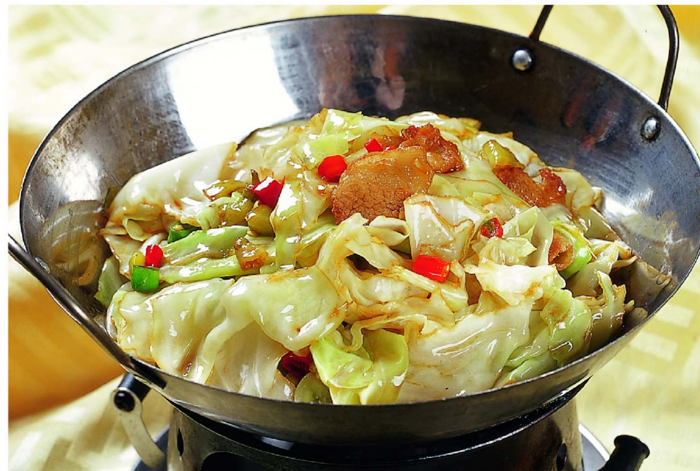
手撕圆包菜 KOL CABE KERING RP/56k