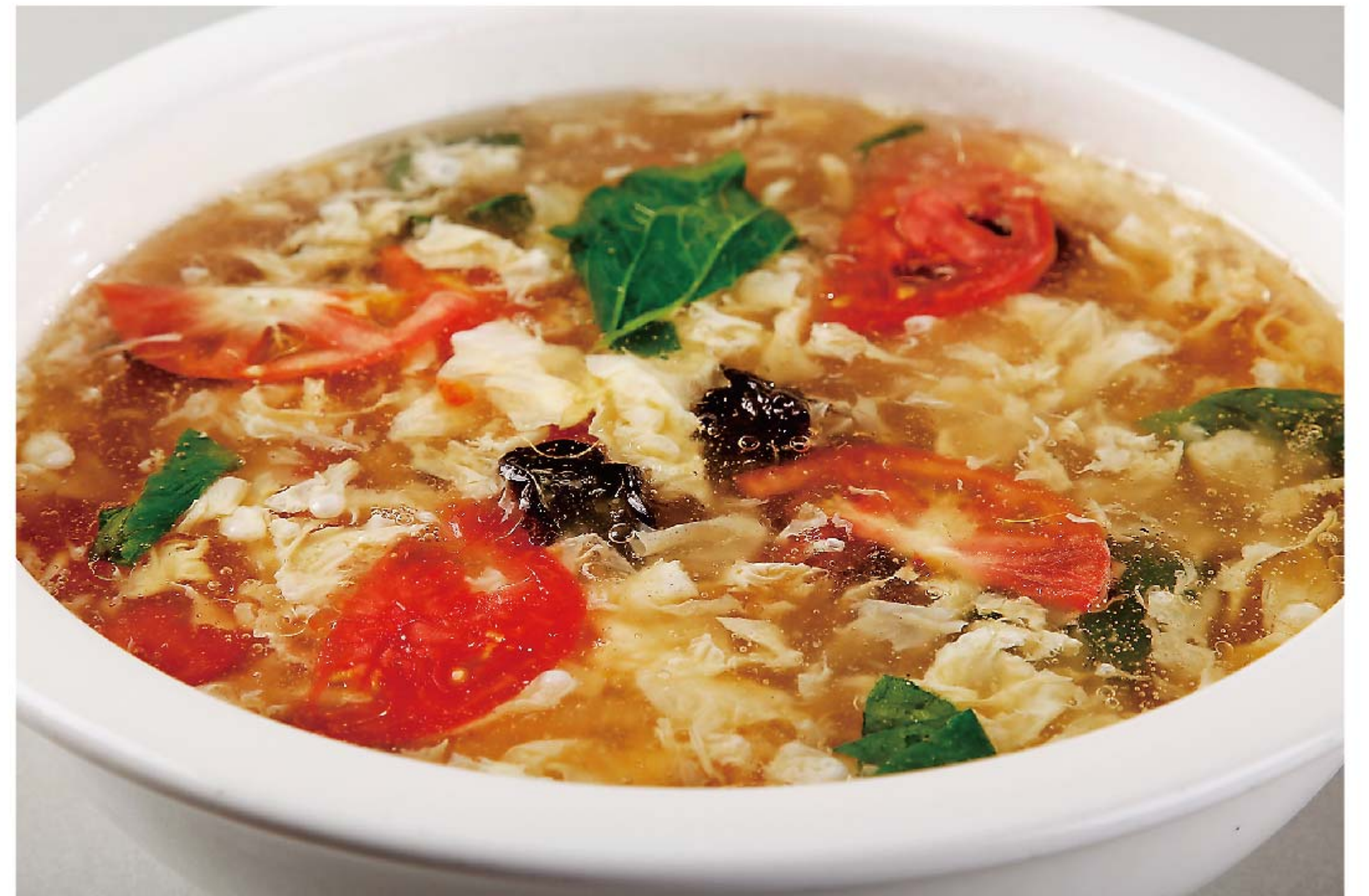
酸辣鸡蛋汤 SUP TELUR ASAM PEDAS RP/58k

图片仅供参考·菜品请以实物为准 Harga belum termasuk pajak 10% dan layanan 5%