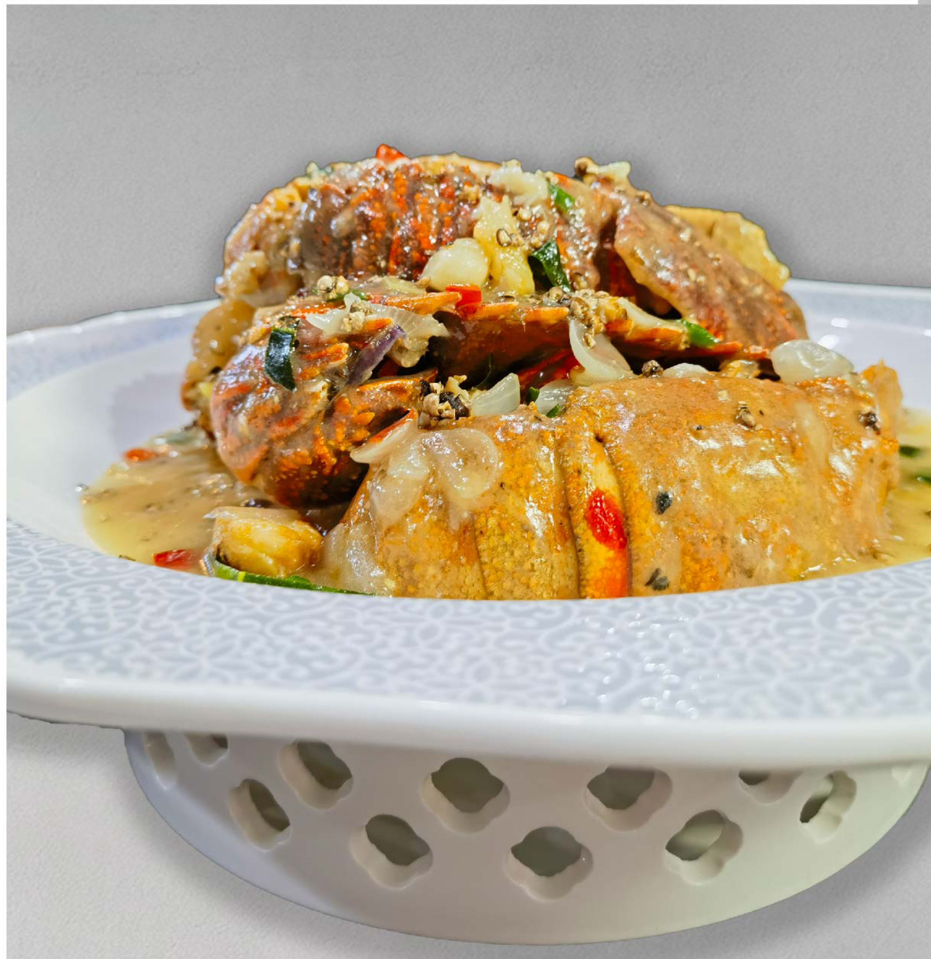
琵琶虾 KEPITING SAOS PADANG RP/时价

图片仅供参考·菜品请以实物为准 Harga belum termasuk pajak 10% dan layanan 5%